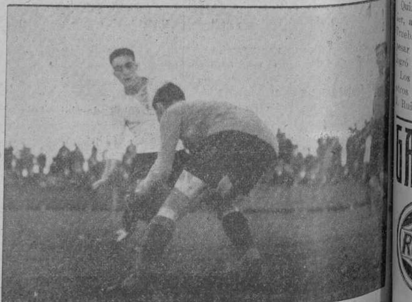
RACING-MURIEDAS.—Ateca entra a Uriarte en una parada de esta