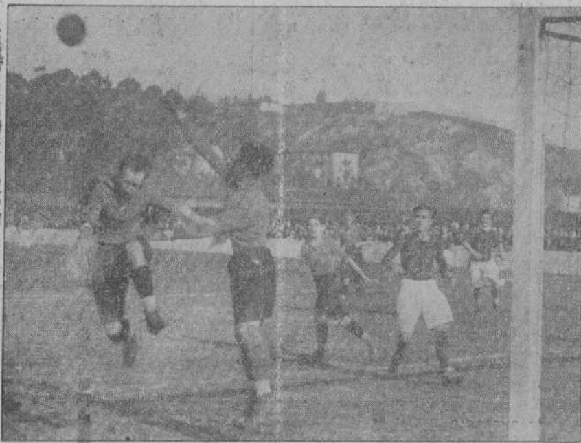
ECLIPSE-UNION CLUB DE ASTILLERO.—Arteche en una oportuna pa-

Por la mañana, y también en Peñacastillo, se jugaron el Athletic y el Barrio del primer campeonato entre el Sporting de la Montaña Olímpica y el Barrio del primer