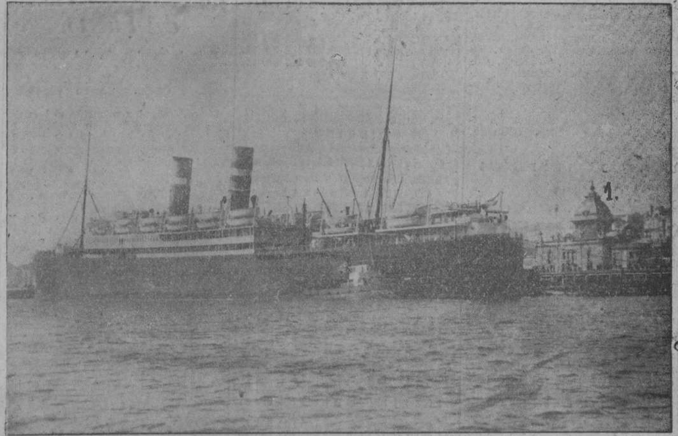
Ofrecemos esta fotografía, obtenida ayer mañana por nuestro compañero Samot (primera de las que pensamos ir publicando), en la que se ve al magnífico trasatlántico «Veenda», de 25.620 toneladas, atracado a pocos metros de la estación de la Costa, circunstancia ventajosísima para el viajero turista.