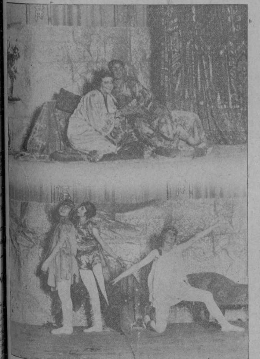
Escenas de la ópera china «Sang-Po», puesta en escena ayer en la Sala Narbón en la función de la Asociación de Cultura Musical. (Foto SAMOT).

«Ladrona de amor» no pasa, en suma, de ser una obra modesta, sin grandes efectos de técnica ni sensiblerías aciertes de situación y de diálogo. Una comedia más, que no se hará vieja en el repertorio, bastante convencional, por lo menos para nos-