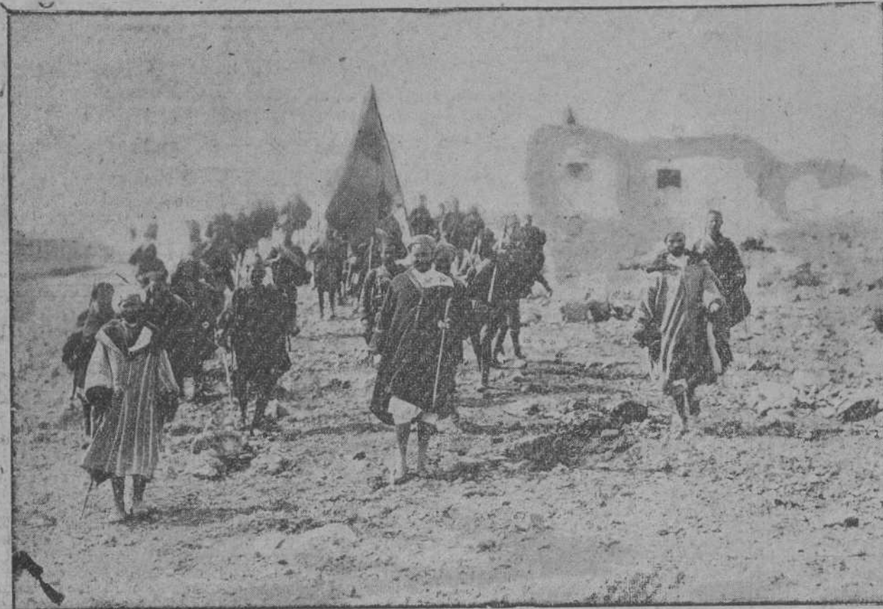
Solimán el Jatavi, que aver dirigió una importante proclama a los rebeldes, dirigiéndose con parte de su jarka a realizar un reconocimiento.

El moro Soliman el Jatavi, primo hermano de Abd-el-Krim, dirige una proclama a los rebeldes aconsejándoles la sumisión.