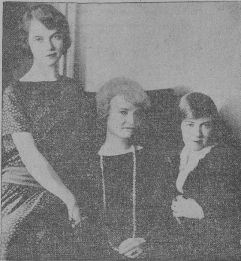
Las célebres actrices cinematográficas Dorothy y Lillian Gish—derecha e izquierda, respectivamente—acompañando a su señora madre en su reciente visita con motivo de sus vacaciones veraniegas, después de dejar ultimados los trabajos de impresión de las películas «La Bohème» y «The Beautiful City».

¿Qué más podemos exigir? Pues nada, el respetable—porque todo hemos de decirlo—, casi siempre disgustado, acude muy contrariadamente a las salas de proyección. ¿Un «desencuadre»? ¡Un escándalo!... ¿Que apagadas las luces el sexteto no ejecuta? ¡Un palmeteo infernal!... ¿Exceso de velocidad para poder terminar el programa a la hora conveniente? ¡Pues son unos estafadores los empre-