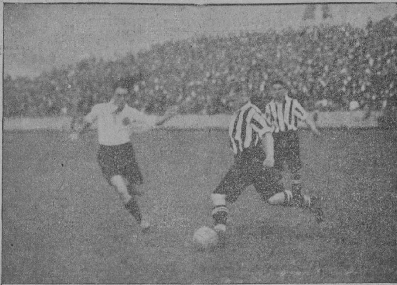
Ateca en una de sus jugadas en el partido celebrado el domingo en San Mamés.

Terminada la prueba se procedió al reparto de premios en la Casa Ayuntamiento.