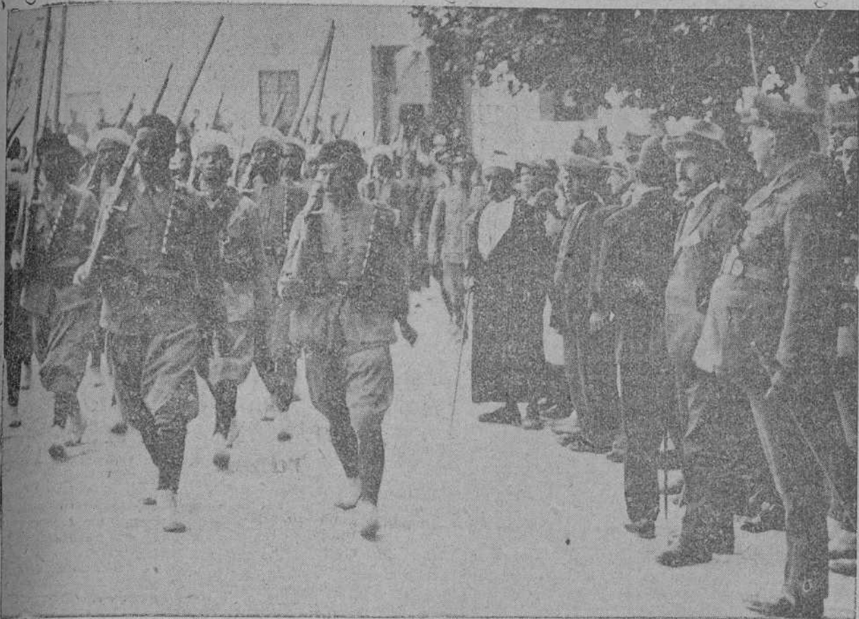
El general Primo de Rivera presencia el desfile de fuerzas antes de marchar a Morro Nuevo.

Se dice que la cabila de Bocoya muestra deseos de someterse.—Lyautey pide al Gobierno francés que le releve de su cargo.—La presión enemiga en el sector francés.—Los partes oficiales del domingo y del lunes.—Otras interesantes noticias de última hora.