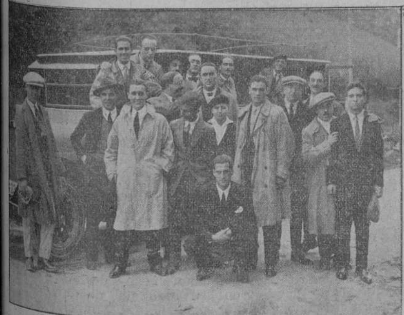
EL EXCURSIONISMO Y EL FÚTBOL.—Grupo de buenos aficionados al deporte que, en una camioneta, se trasladó el domingo a Bilbao para ver el partido Athletic-Racing.

El alcalde interino don Manuel Galán carecía ayer de noticias para facilitar a los informadores de los periódicos de la localidad. Les dijo únicamente que hoy se reunirá la Comisión municipal de Beneficencia, la que se ocupará principalmente de informar la solicitud presentada por la Comisión del homenaje al marqués de Valdecilla. La Comisión se encuentra animada del mejor deseo para secundar con la mayor eficacia los fines perseguidos por los solicitantes.