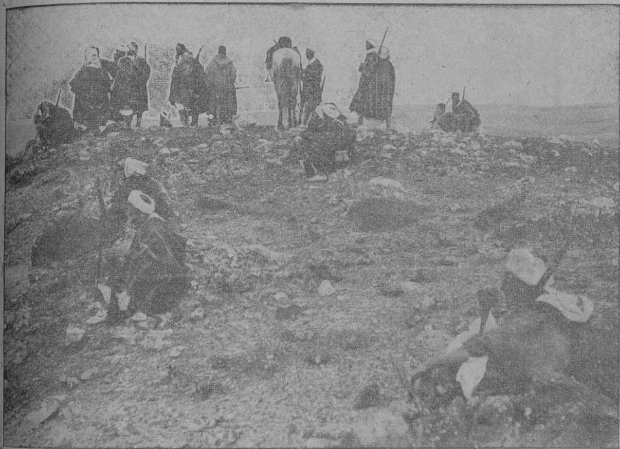
DE LAS ÚLTIMAS OPERACIONES.—Moros de la jarka que manda el comandante Varela, ocupando una altura en la costa de Alhucemas.

Informes particulares afirman que Abd-el-Krim se pondrá al frente de las jarkas para combatir con franceses y españoles.—Los rebeldes intentan infructuosamente asaltar nuestros campamentos de Alhucemas.—Según confidencias recibidas, el enemigo se halla desalentado por nuestros últimos triunfos en Kudia Tahar.—El temporal dificulta las operaciones de desembarco.—Otras noticias interesantes de última hora.