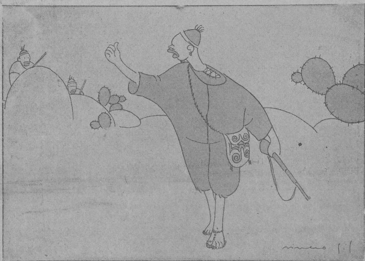
—¡Atención, mojamés, que hay moros en la costa!..