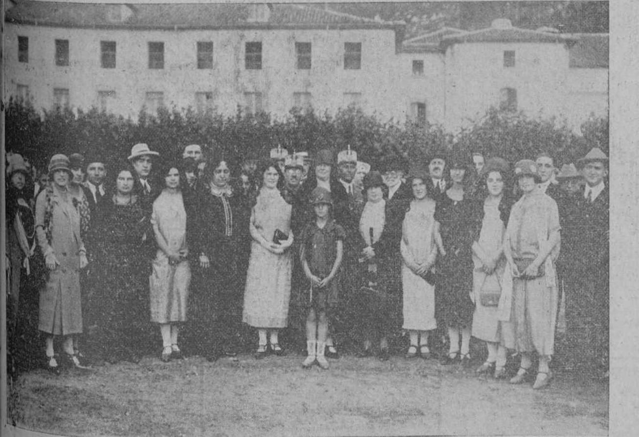
SANTONA.—Las madrinan de las banderas de los distritos del partido, en el solemne acto celebrado el domingo.