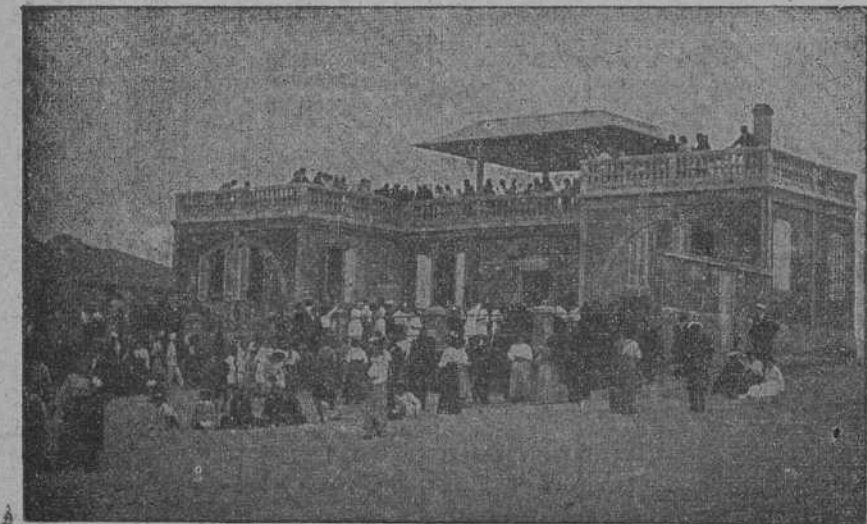
SANTOÑA.—Un detalle del magnífico balneario de Berria.