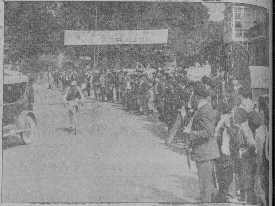
Los corredores al paso por el control de Solares.