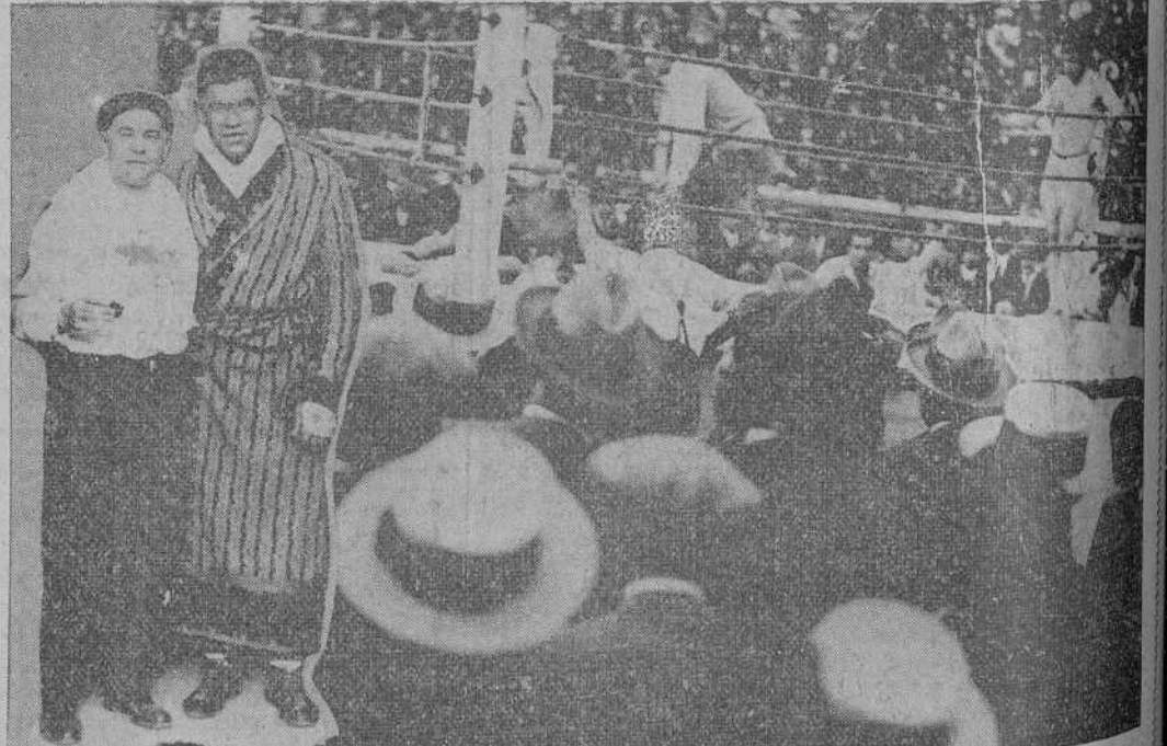
Dos notas del macho de boxeo Uzcudun-Scott, organizado por "Excelsior", en Bilbao.

SANTOÑA Nu Al La op ceses.— M EL Nuestra por su eno expansión amos felicit La toma corno el ca problema d En las En reaccion los pr pública vol para por la ser acada rebeldía. —Se di —Ya es Es decir militar, por de nuesta operación Pues ya más, pisan operación aje efecto que Y, patri de el d los jefes qu operación. En la s Mov FEZ. 8.— gran activi gentes de t otías en los dos en los tidos por f ues, con gr que han sid no como pr par el comb Parece se españolas mento a ot nes combin monos de ad De momen se ha de p nes habrá vacins tribu cer a las que no pue ataques del sus repres RE MILLILLA escuadrilla Alfonso, ef por el fren dad. + Su y Co rela senda t ria nos p Ajo