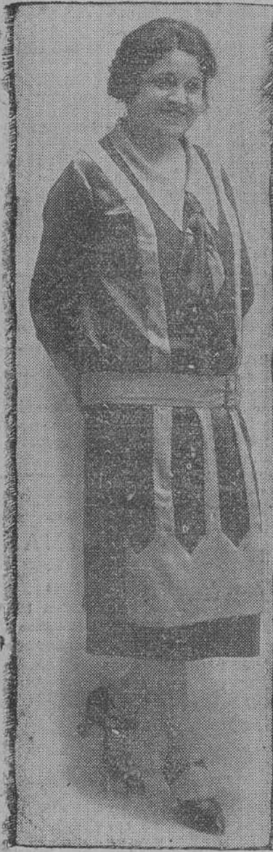
La bella y notable actriz Carmen Díaz, que debuta mañana en el Gran Cinema.

Mañana debutará en el Gran Cinema una gran Compañía de comedia, a cuyo frente viene actriz de tanto prestigio como Carmen Díaz, retirada por algún tiempo de la escena