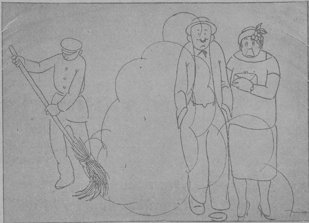
—¡No somos nada... —Polvo tan solo...