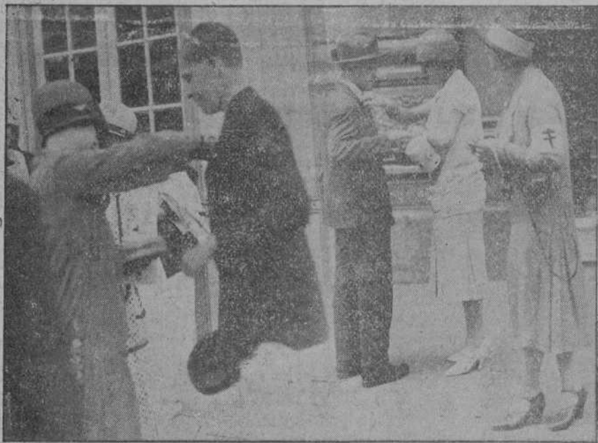
ESCENAS DE LA FIESTA DE LA FLOR.— El príncipe de Asturias, en el embarcadero, contribuyendo a la fiesta benéfica del lunes. Dos bellas señoritas portulantes en pleno asalto. (Foto SAMOT).