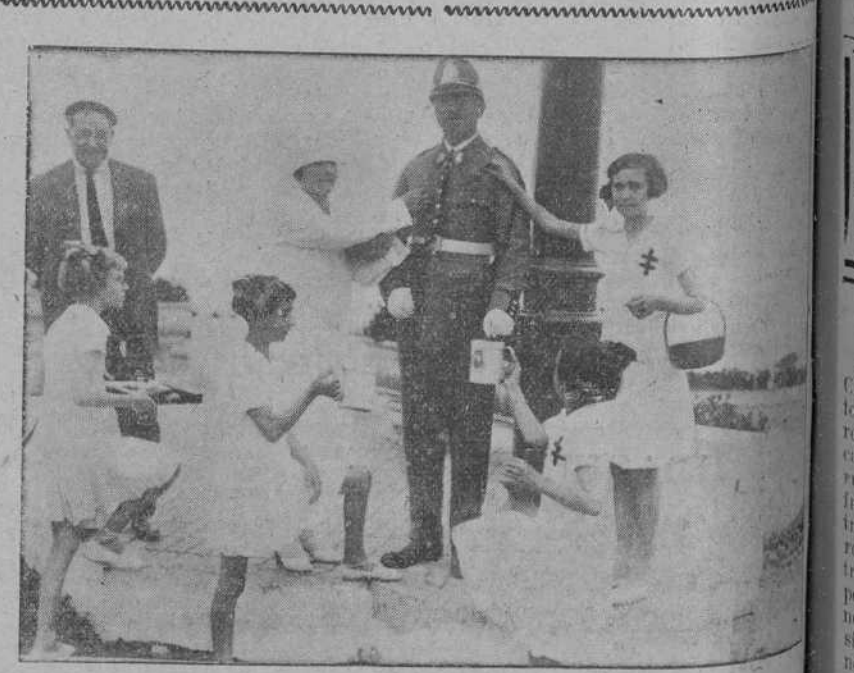
Una de las notas más simpáticas de la fiesta de la Flor fue el concurso como postulantes de las niñas madrileñas de la colonia de Pedrosa.