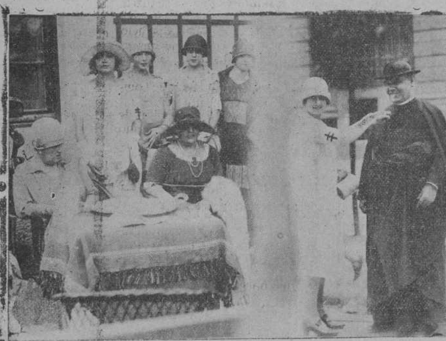
DE LA FIESTA DE LA FLOR.—Detalle del puesto instalado en la Magdalena.—Una linda postulante coloca una flor a un sacerdote.

Esta es la gran obra que Torrelavega tiene que acometer. Queremos poder. Entretanto, a conseguir el adonamiento de las carreteras; después que éstas estén bien niveladas, a conseguir más grupos escolares, mejor alcantarillado, un buen parque de recreo y una gran avenida prolongación del actual bulevar que llegue hasta el paseo de J. F. Vallejo, donde se han enclavado las escuelas inauguradas