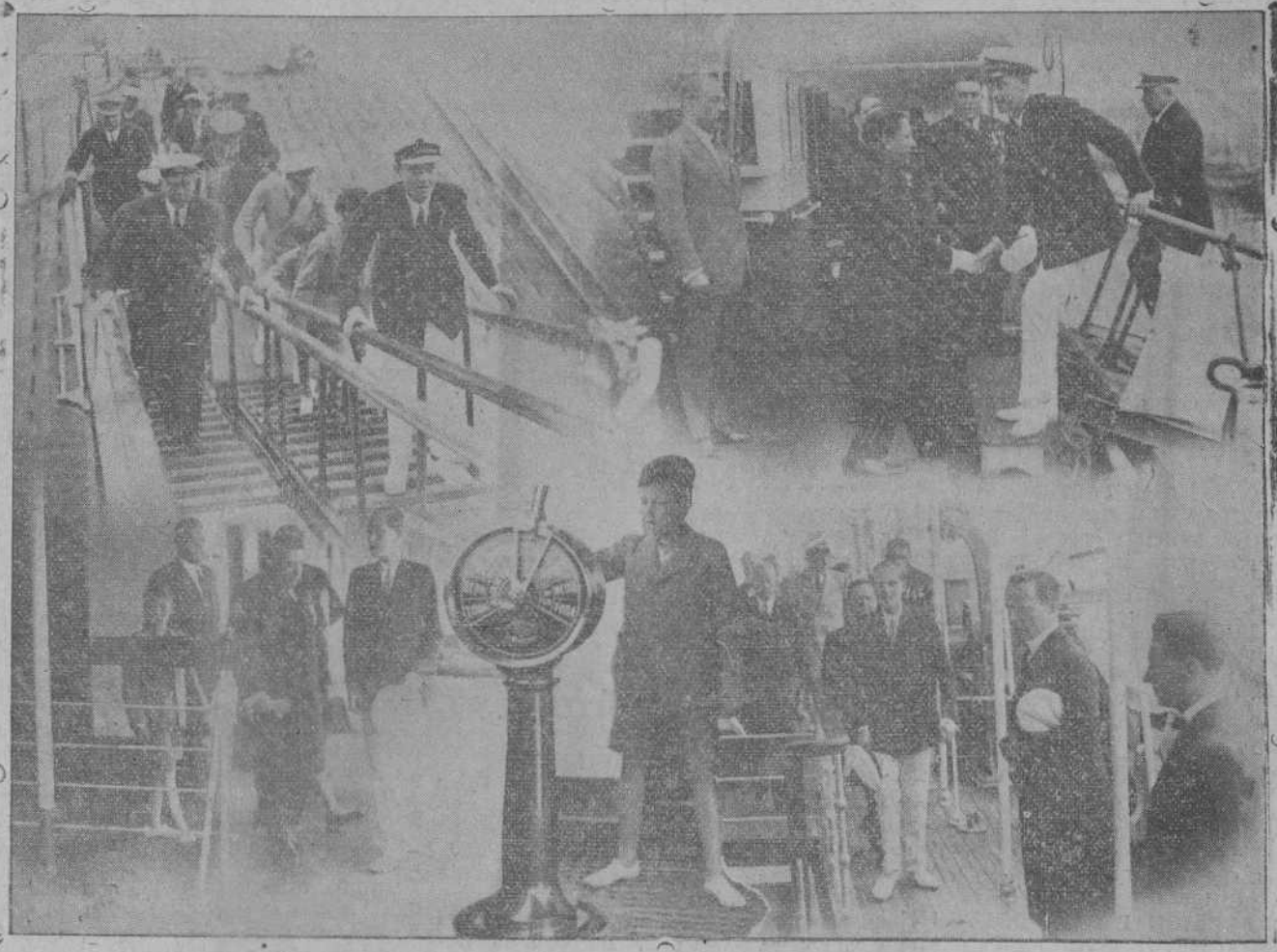
Varios detalles de la visita de Sus Altezas el príncipe de Asturias y los infantes al «Cristóbal Colón». (Foto SAMOT).

Al mediodía de ayer, subieron al regio alcázar de la Magdalena con propósito de complimentar a Su Majestad el Rey, el capitán del trasatlántico español «Cristóbal Colón» y el