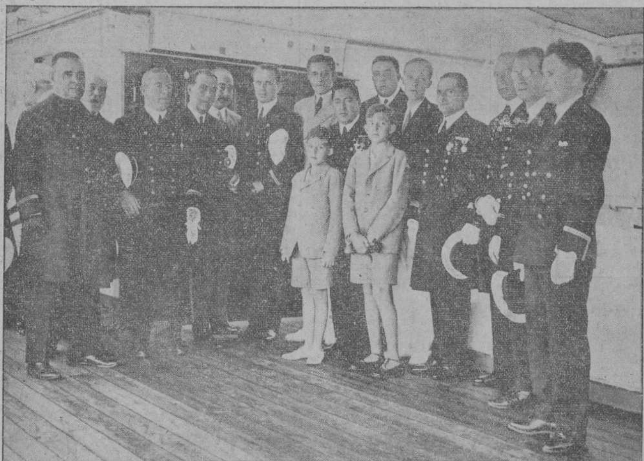
El príncipe de Asturias y los infantes don Jaime, don Juan y don Gonzalo, con el capitán y los oficiales del trasatlántico «Cristóbal Colón», grupo obtenido ayer durante la visita hecha por Sus Altezas al hermoso barco.

Las gentes están esta noche en las calles tomando el fresco.