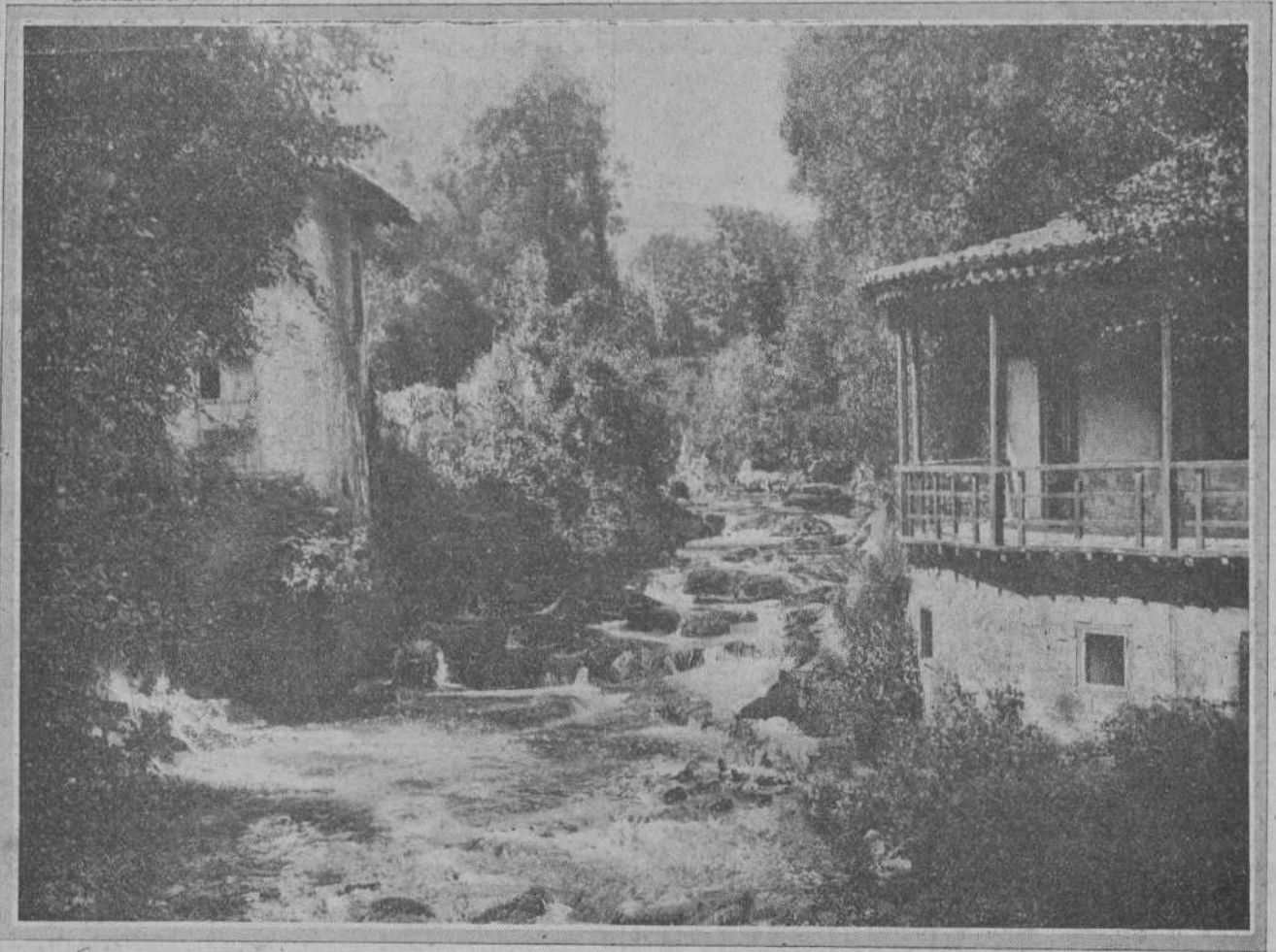
RINCONES DE LA PROVINCIA.—HOZNAYO: UN DETALLE DE LA FUENTE DEL FRANCÉS. F. Samot.

Por eso ha respondido la provincia entera al llamamiento, y el próximo domingo de julio vendrán jubilosamente a la capital gentes de toda la Montaña, que darán a Santander una extraordinaria animación.