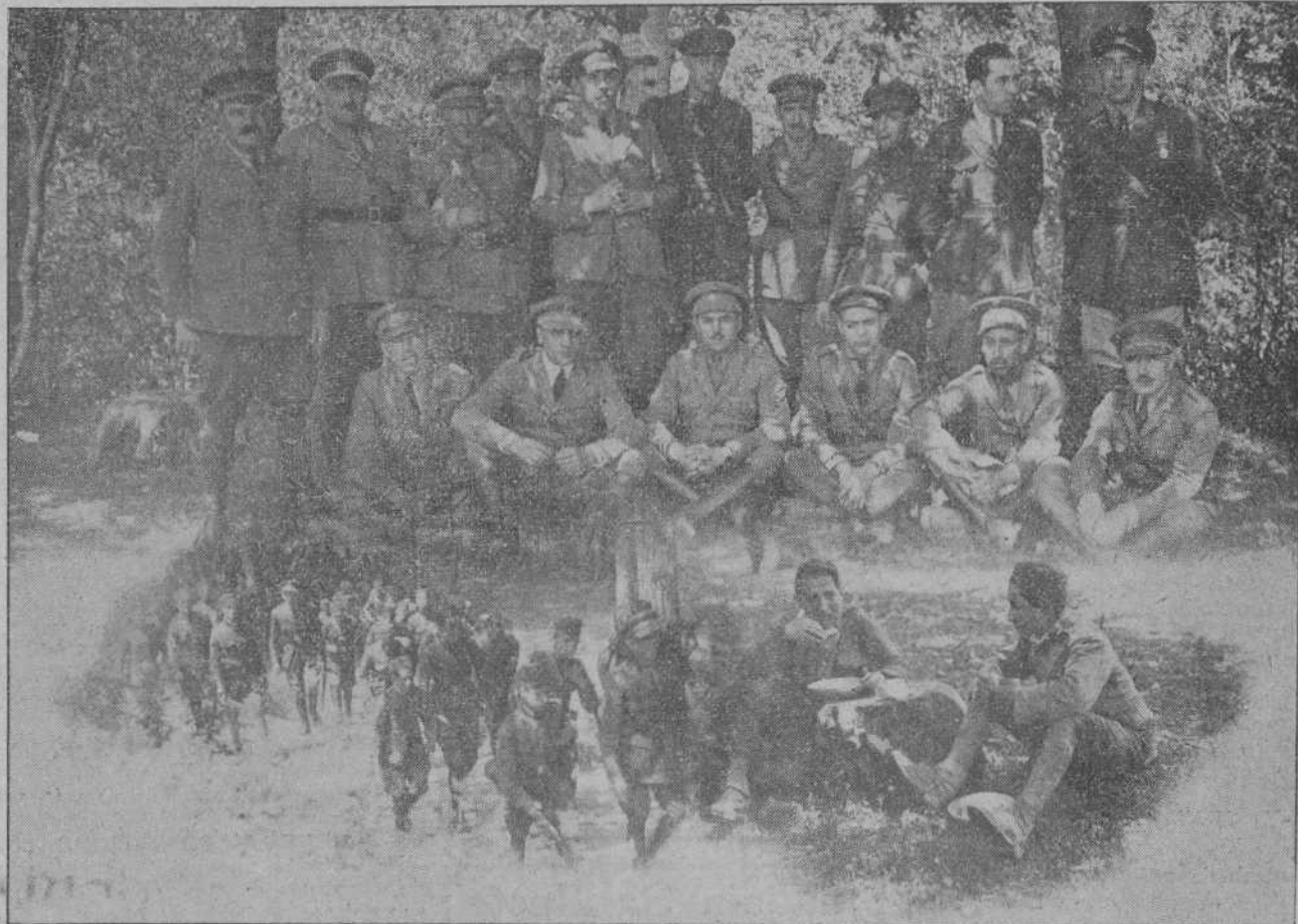
LA OFICIALIDAD QUE MANDO LAS FUERZAS DE VALENCIA DURANTE EL SIMULACRO DE GUERRA EFECTUADO AYER MAÑANA.—DOS DETALLES DE LAS MANIOBRAS.

Sexto.—Villalta lancea con temple por lo que es muy arlaudido. Con la muleta comienza con tres pases muy buenos; sigue con un farol superior y entrando muy bien remata de una buena estocada que le vale ovación y oreja.