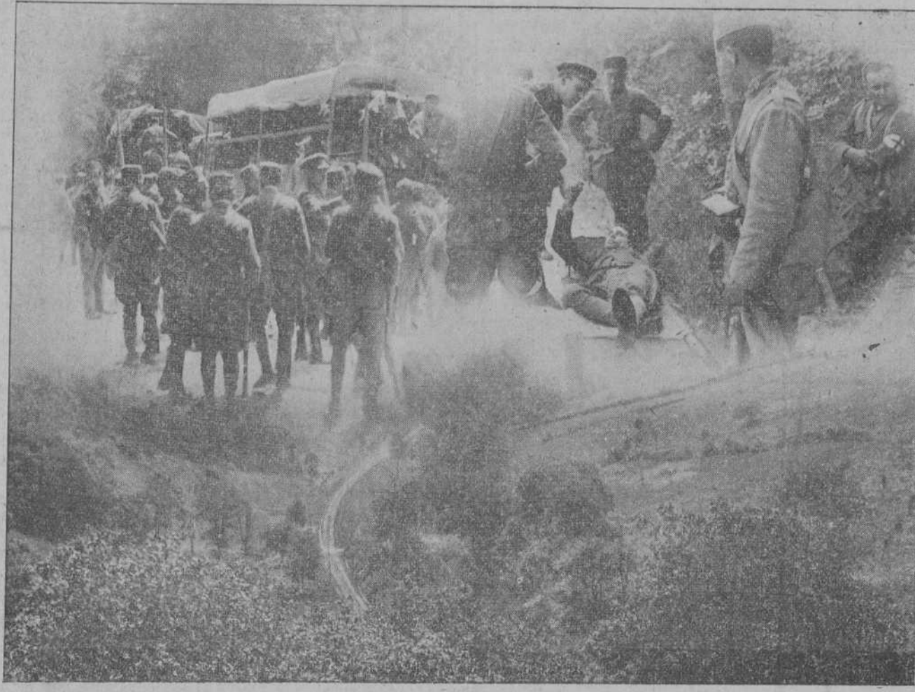
LLEGADA DE LA TROPA A LAS PRÓXIMIDADES DE BERANGA, DONDE SE CELEBRO EL SIMULACRO DE GUERRA.—UNA «BAJA» DURANTE EL EJERCICIO.—VISTA GENERAL DEL LUGAR DONDE SE VERIFICO LA MANIOBRA. (Fotos Sammot).

No podrá torear antes del día que lo hará en Toledo, y es posible que después se traslade a Alcañices para ser operado de la fístula que le duece y al su regreso seguirá toreado hasta cumplir los compromisos adquiridos.»