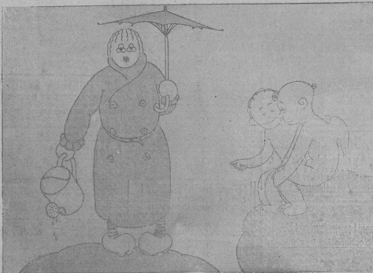
—¿NO LA CONOCES? ES LA SEÑORITA PRIMAVERA.