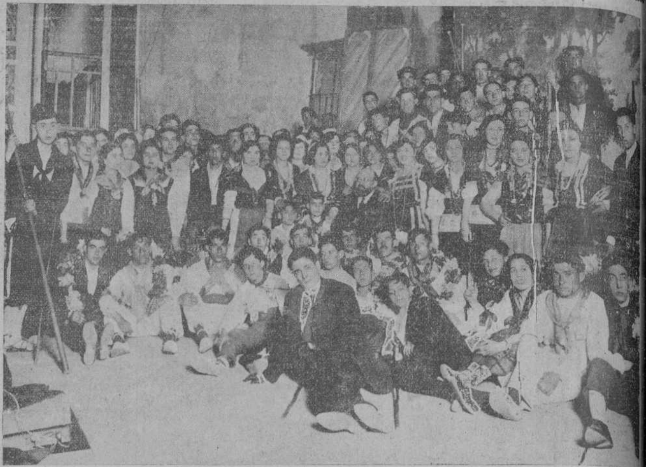
GRUPO DE LOS INTERPRETES DE «LA ROMERIA DE MIERA», REPRESENTADA EN EL GRAN CINEMA A BENEFICIO DEL NUEVO HOSPITAL.