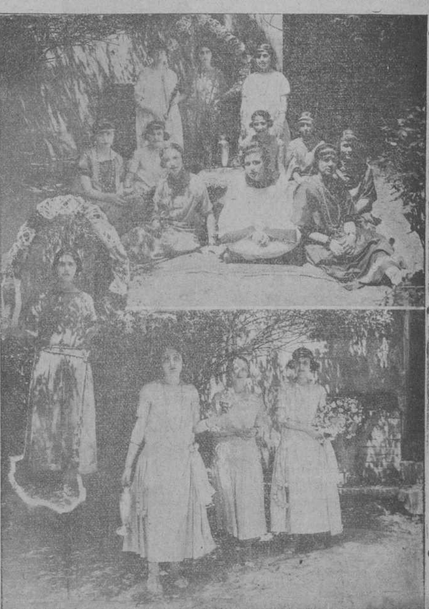
DISTINGUIDAS SEÑORITAS DE LA ESCUELA NORMAL DE MASTRAS, QUE INTERPRETARON «LOS CANTOS DE LA CULTURA» DE CALDERON DE LA BARCA, EN LA ULTIMA CLASE DE LITERATURA, VERIFICADA EL SABADO.