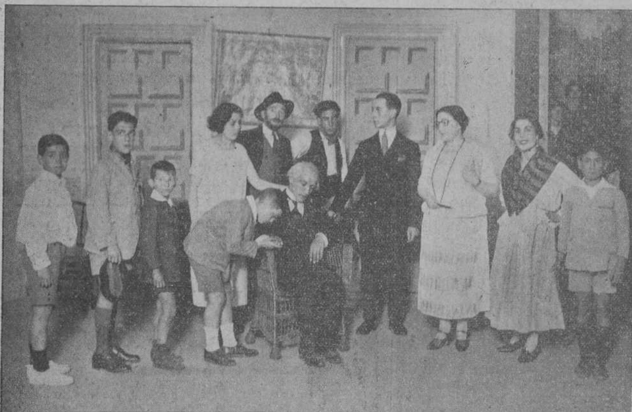
UNA ESCENA DE «LA LEYENDA DEL MAESTRO», REPRESENTADA EN EL GRAN CINEMA, EN LA BRILLANTE FUNCION ORGANIZADA A BENEFICIO DEL NUEVO HOSPITAL.

El niño fué recogido completamente ileso y entregado a sus padres.