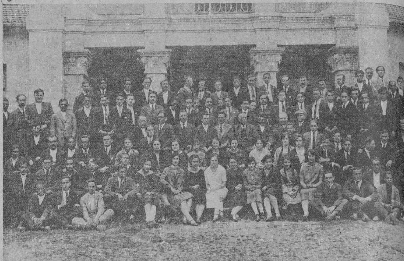
SOLARES.—EL NOTABLE ORFEON MONTANES TRASMERANO.