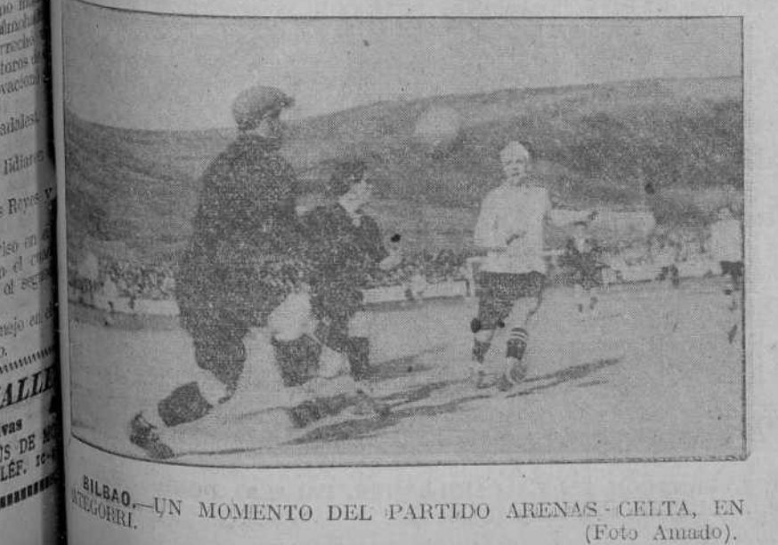
BILBAO.—UN MOMENTO DEL PARTIDO ARENAS-CELTA, EN.

Provocada por mí, se celebró una reunión de los anteriores directivos, con los nuevos, o sease actuales, y en ella se les expuso el objeto de la misma, que no era otro sino ver la manera de ponernos de acuerdo en lo concerniente a los créditos que tenía el Racing con el aval de los directivos cesantes, y de que SUS FIRMAS SE UNIERAN A LAS NUESTRAS que sosteníamos en todo momento, a lo cual contestaron el no poderlo hacer por el acuerdo unánime que habían tomado de no suscribir y menos avanzar cuenta alguna de la Sociedad. Si luego se les pudo disuadir para que siquiera lo hicieran en nombre del Racing, tal y como venía haciéndose por el presidente y tesorero, sin comprometerse para ello, puesto que el aval seguiríamos prestándole los mismos que hasta hoy le tenemos, no costó poco trabajo. El tiempo ha pasado,