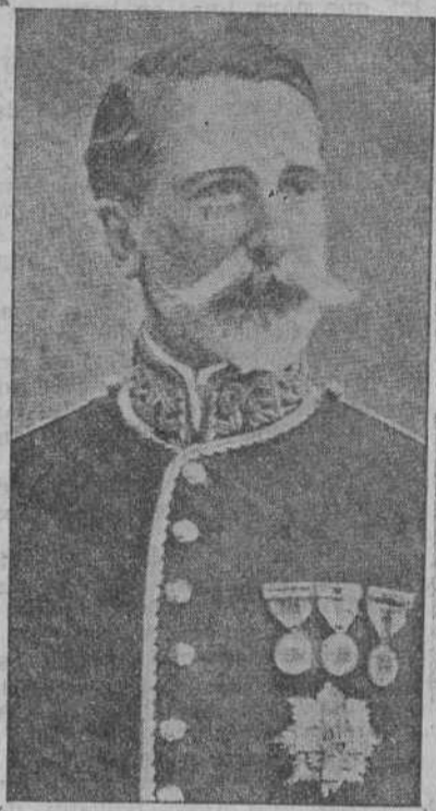
EL MARQUES DE COMILLAS, FALLECIDO AYER EN MADRID

EL PUEBLO CANTABRO hace presente su pésame a la ilustre familia del finado y eleva al cielo una oración por el eterno descanso de su alma.