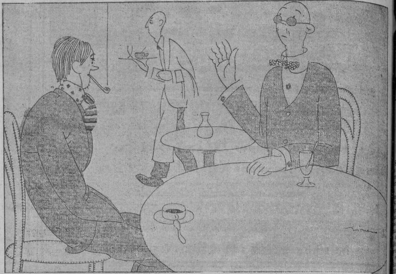
—CONVENGA USTED EN QUE EL GENIO NO EXISTE. —¿POR DIOS! ¿DONDE DEJA USTED A BENAVENTE?...

En todas las calles del tránsito fueron aplaudidísimos, así como a la llegada al Ayuntamiento, encontrándose