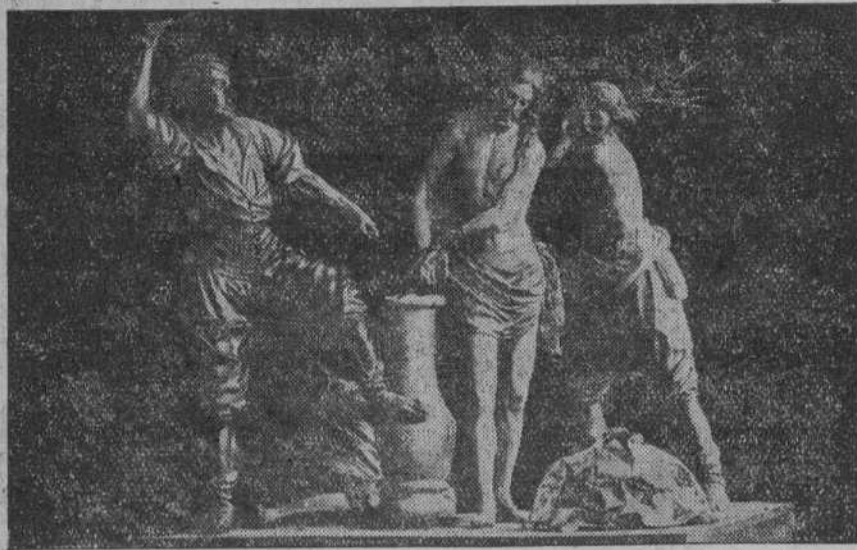
DE LAS PROCESIONES DE MURCIA.—EL PASO DE «LOS AZOTES», OBRA DE SALSILLO, TERMINADA EN 1778.