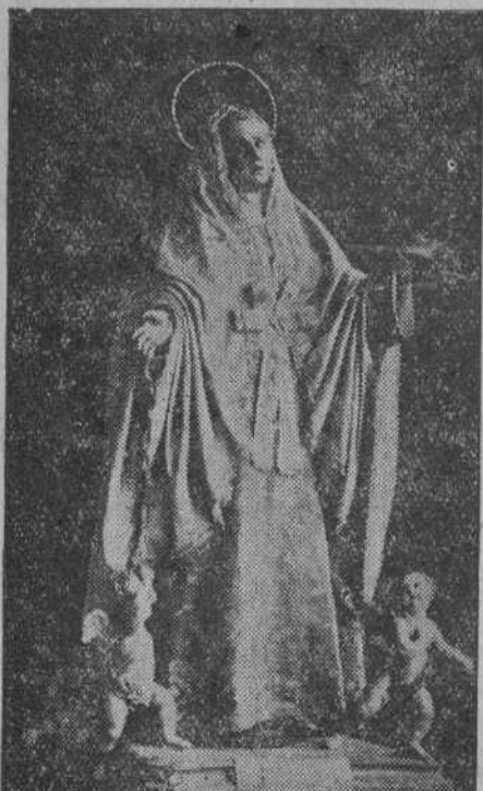
LA DOLOROSA, ESCULTURA HECHA POR SALSILLO EN 1753, QUE FIGURA EN LAS PROCESIONES DE MURCIA