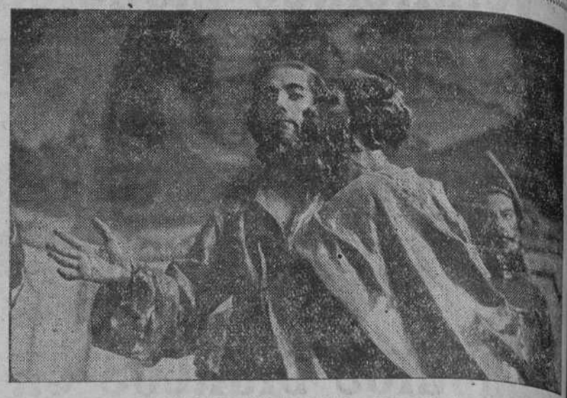
DE LAS PROCESIONES DE MURCIA.—UN DETALLE DEL PASO «EL PRENDIMIENTO», OBRA DEL GENIAL SALSILLO.

En 1924, las Universidades y Colegios y Escuelas Normales y de otras clases de Rusia, extendieron títulos a quince mil nuevos maestros que inmediatamente fueron empleados en las Escuelas públicas. La nueva clase de maestros rusos es de muchos mayores alcances intelectuales que la antigua; aunque también es verdad que recibe excelente paga y distinguida consideración social y gubernativa.