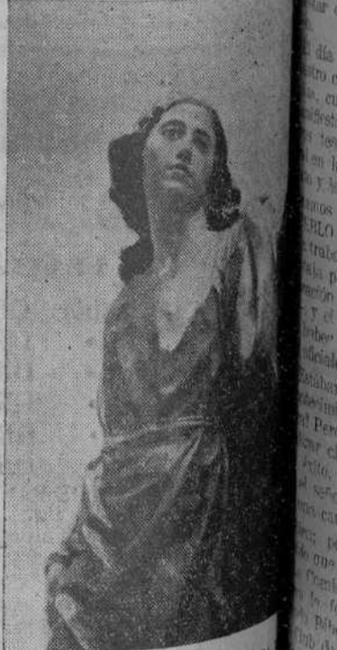
SAN JUAN, BELLA ESCULTURA HECHA POR SALSILLO, QUE FIGURA EN LAS PROCESIONES DE MURCIA

Pagos forzados, 9.357,71 pesetas; existencias para hoy, 174.839,38 pesetas.