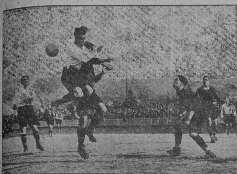
AYER EN BILBAO.—UNA CABEZA DE PEPIN DIEZ DURAN. (Foto SAMOT).

por alto, los areneros eran dueños de la situación, y en cuanto alguien no sabemos quién—hizo ver el capitulo más defectuoso en que se incurrió, las tornas se cambiaron, desconcertándose a la parte contraria.