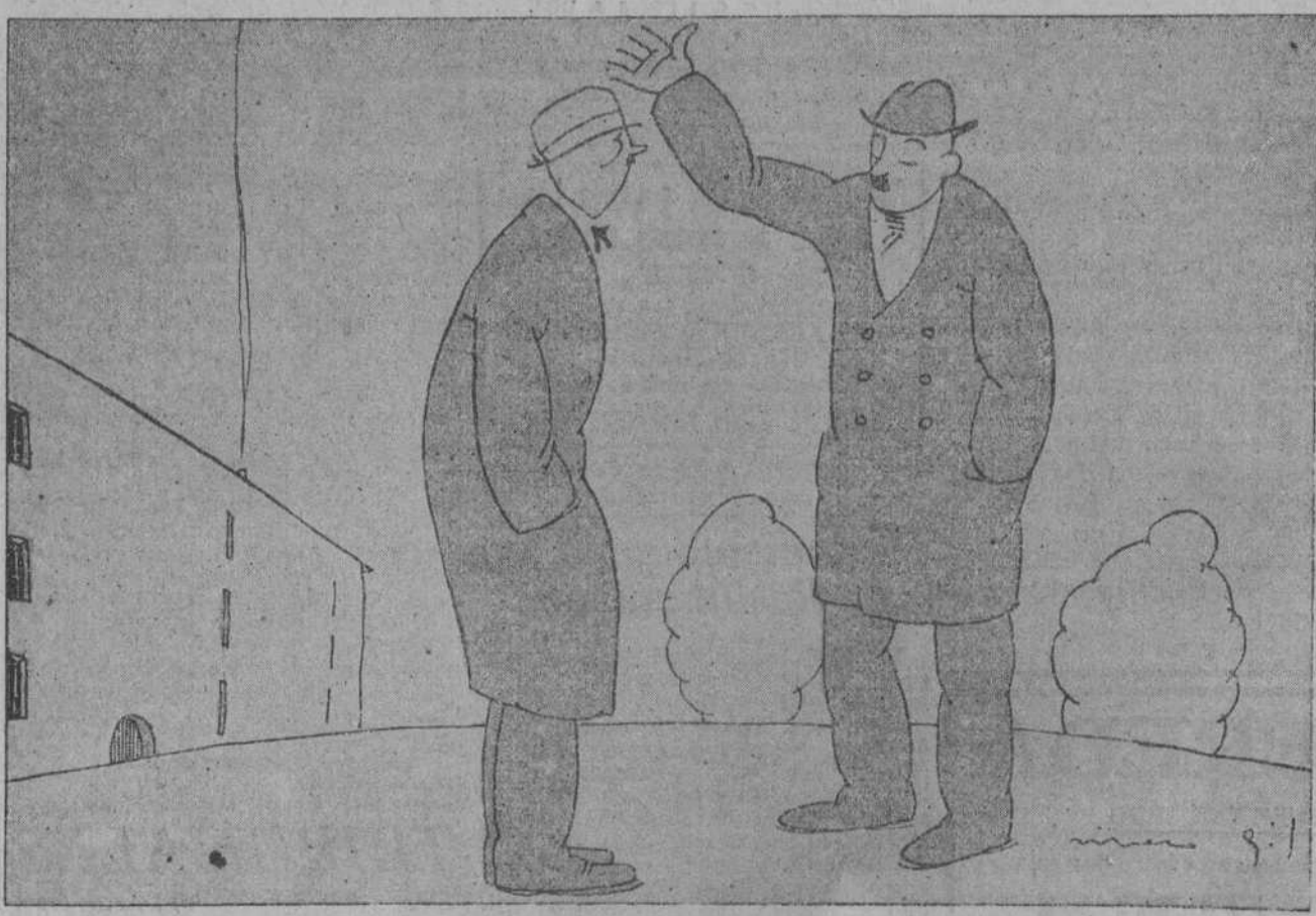
—GRACIAS A DIOS, HOMBRE! —QUE TE PASA? —QUE TENIA QUE DAR UN REGALO POR TELEFONO Y AHORA, CON EL MEJORAMIENTO DEL SERVICIO, TENGO LA SEGURIDAD DE QUE LO PODRE HACER ANTES DE CUATRO O CIN MESES.