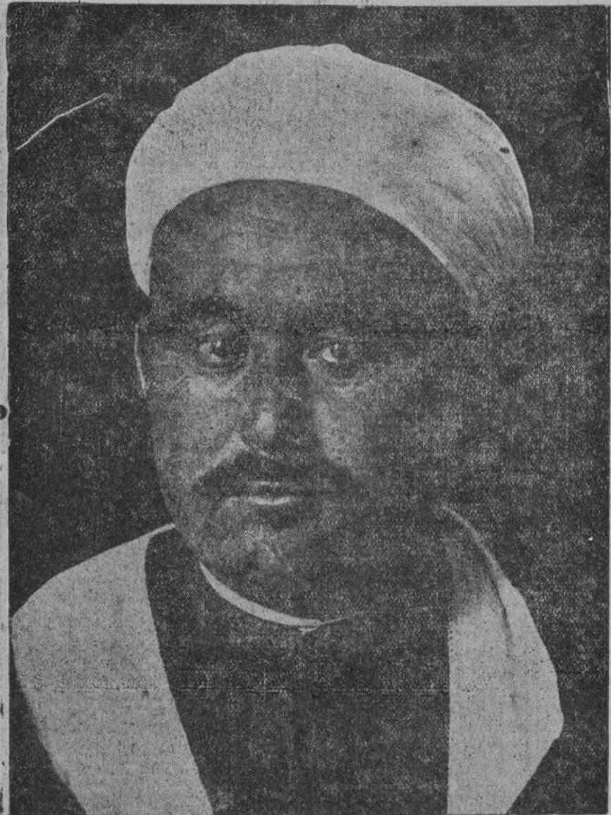
EL CABECILLA MORO ABD-EL-KRIM, A QUIEN, SEGUN NOTICIAS DE PROCEDENCIA SIGNIFICATIVA, QUE PUBLICAMOS HOY, DAN POR MUERTO, INCLUSO SUS PARTIDARIOS

Se habla insistentemente de la muerte de Abd-el-Krim.