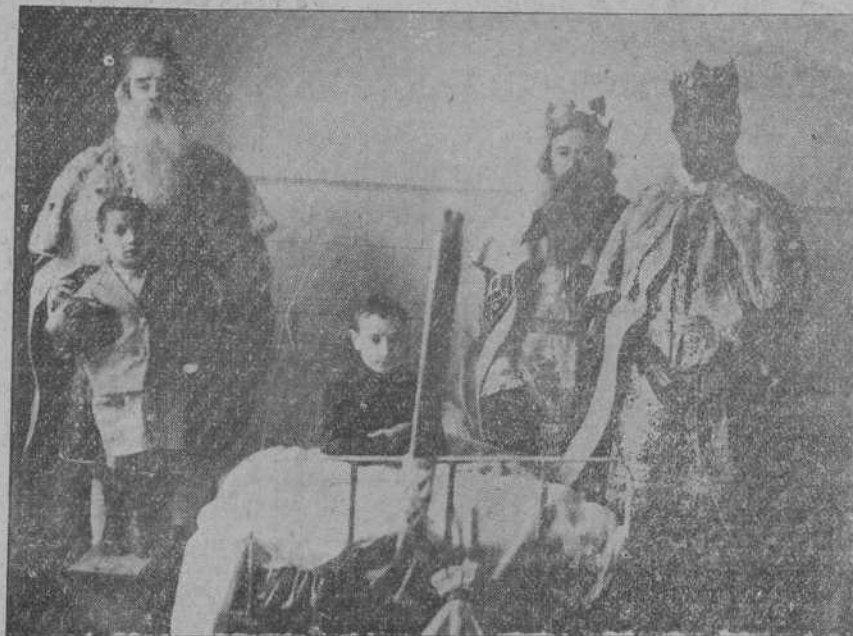
LOS MAGOS EN EL HOSPITAL.—También los Reyes Magos, en su bondad, descienden a las camas de los enfermos para llevarles sus presentes y aliviar sus dolencias con la más pura ilusión.

Se cree que este ensayo dará buen resultado y que no tardarán en aparecer nuevos cargamentos destinados a abastecer todas las capitales de la Península, contribuyendo a abaratar considerablemente el precio de este artículo.