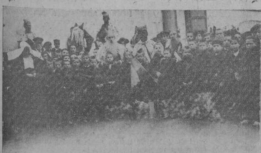
Los Magos en la Casa de Caridad, rodeados de los pequeños asilados.