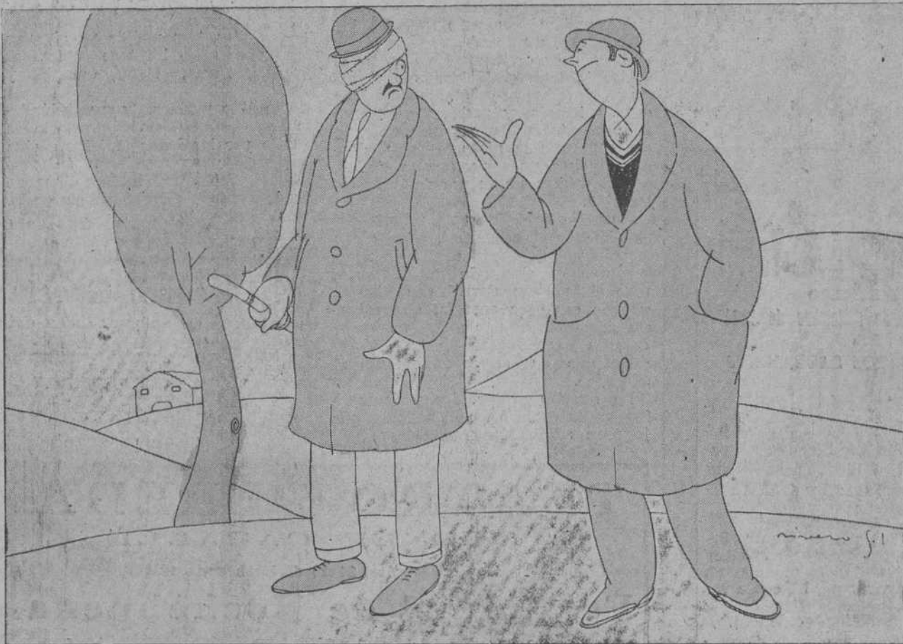
—Fue una piedra lanzada por unos chicos... —¿Ve usted? Para que luego no conceda importancia a los cantos populares.

En Chicago ha bajado la temperatura a 6° bajo 0 Celsius, y en Ohio ha llegado a 40° bajo 0 C. Este descenso se ha operado en veinticuatro horas. En Minnósota hace 24° bajo 0 C., en Wisconsin, 30° idem id., y en Montana, 40° idem idem.