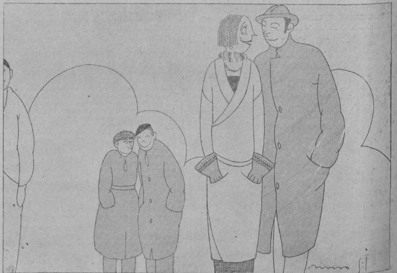
—Si la hubieras visto el otro día toda colorada porque una amiga la puso verde... Parecía que la estaba uno viendo en plastigrama.