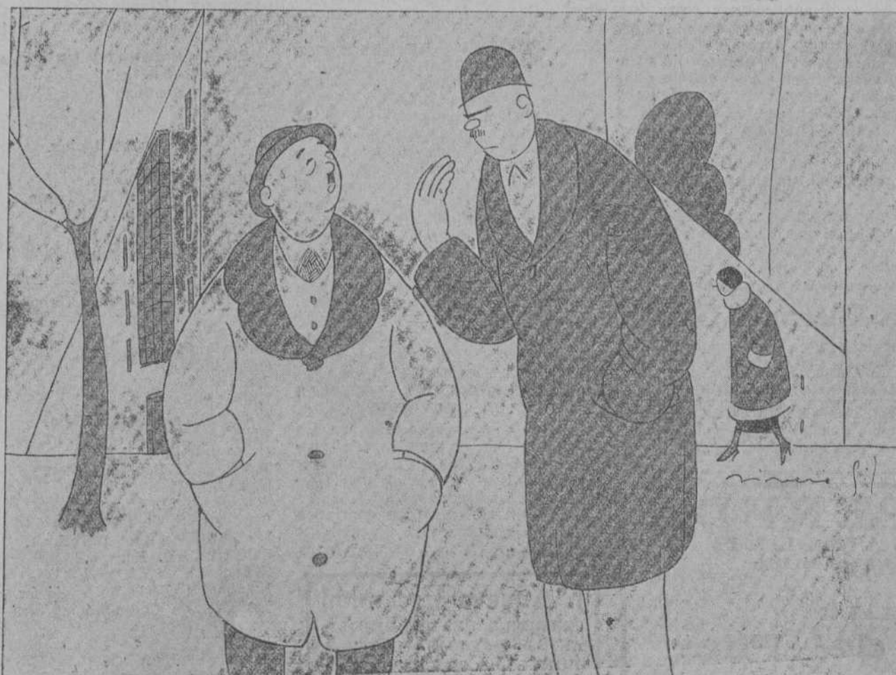
—El tabaco destroza el organismo. Debiera hacerse una campaña hasta lograr que no hubiera fumadores. —Imposible. Mayor campaña que la que está haciendo la Tabacalera...