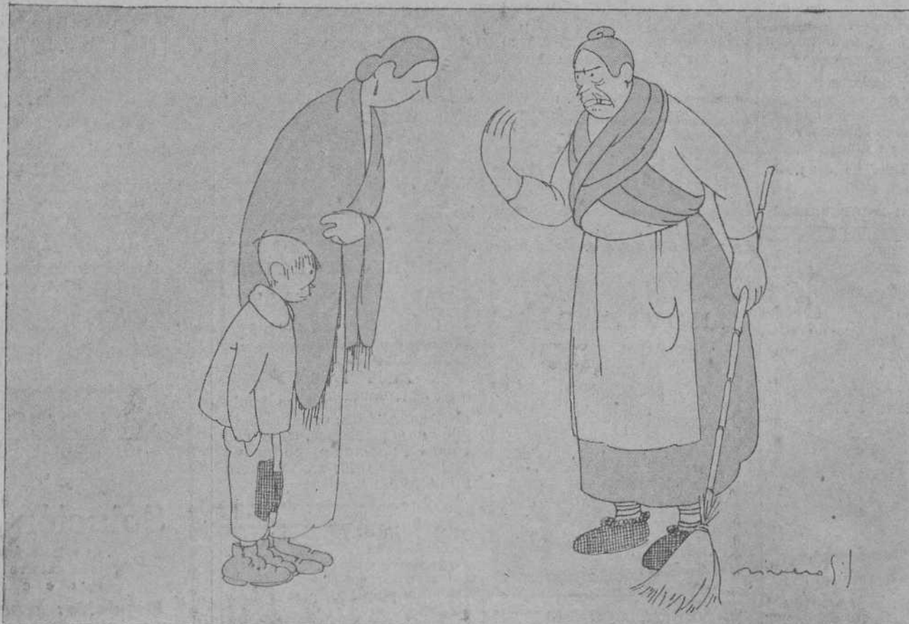
—¡Míá que creer en espiritus!... La culpa la tie su marío, que es el espíritu de la contradicción.