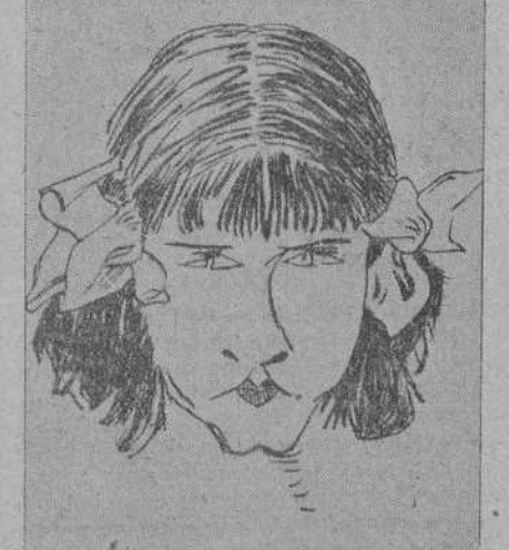
¿A qué actriz cinematográfica pertenece esta caricatura?