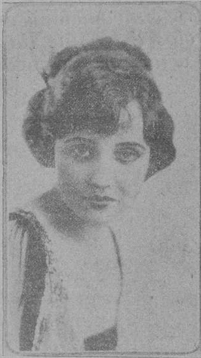
Rubia como el color de los trigales... que diría el poeta: de preciosos ojos y lineas armoniosas, Agnes Ayres reúne todas las cualidades necesarias para dedicarle un soneto plebérico de sentimentalismo y fantasía.

Para amenizar los ratos de ocio y las noches en que no se puede filmar, había una orquesta en el campamento