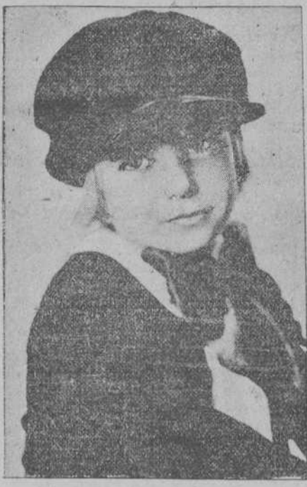
JACKIE COOGAN, «el niño prodigio», que acompañado de su padre, se halla en viaje por Europa repartiendo donativos para los niños desamparados.

nes?... ¿Y qué puede esperarse del desordenado?... «Con el desorden no se cultiva la voluntad ni la inteligencia decía, y es bien sabido, noches pasadas en nuestro Ateneo el doctor Aguado.—Hay que observar, añadia, la vida natural como único medio de contrarrestar los efectos perniciosos del régimen de vida actual, a fin de que seamos más morales; y no es natural, violentar el espíritu, avivar las pasiones, dejar sueltas las riendas de nuestros inmoderados apetitos. Es necesario huir—¡que es cosa seria, lector amigo!—de cuantos quieren disculparlo todo, so pretextos artísticos. El arte es la belleza, y la belleza es labor del alma sosegada y pura, capaz de llegar a vislumbrar glorias imperecederas; y no es que ni los que piensan como yo, vemos el arte de distinto modo; no nos ocurre en esto lo que le ocurría a Moratin, que, según cuentan, veía a Shakespeare como quien ve un bordado del revés. No. Es que somos, aunque modestos, críticos utilitarios, y pedimos al arte ejemplos moralizadores, no perniciosas fantasías que excitan el espíritu hasta debilitarlo y rendirlo, y se encierran en el corazón tan reciamente, que llegan a cubrirlo de moho y herrumbre, señales tristes de caducidad, de acabamiento. Ya sé que habrá quien me dea y proteste, porque gusta de salsas azufradas; ya sé que habrá quien me