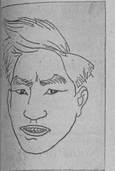
¿Qué actor cinematográfico pertenece esta caricatura?