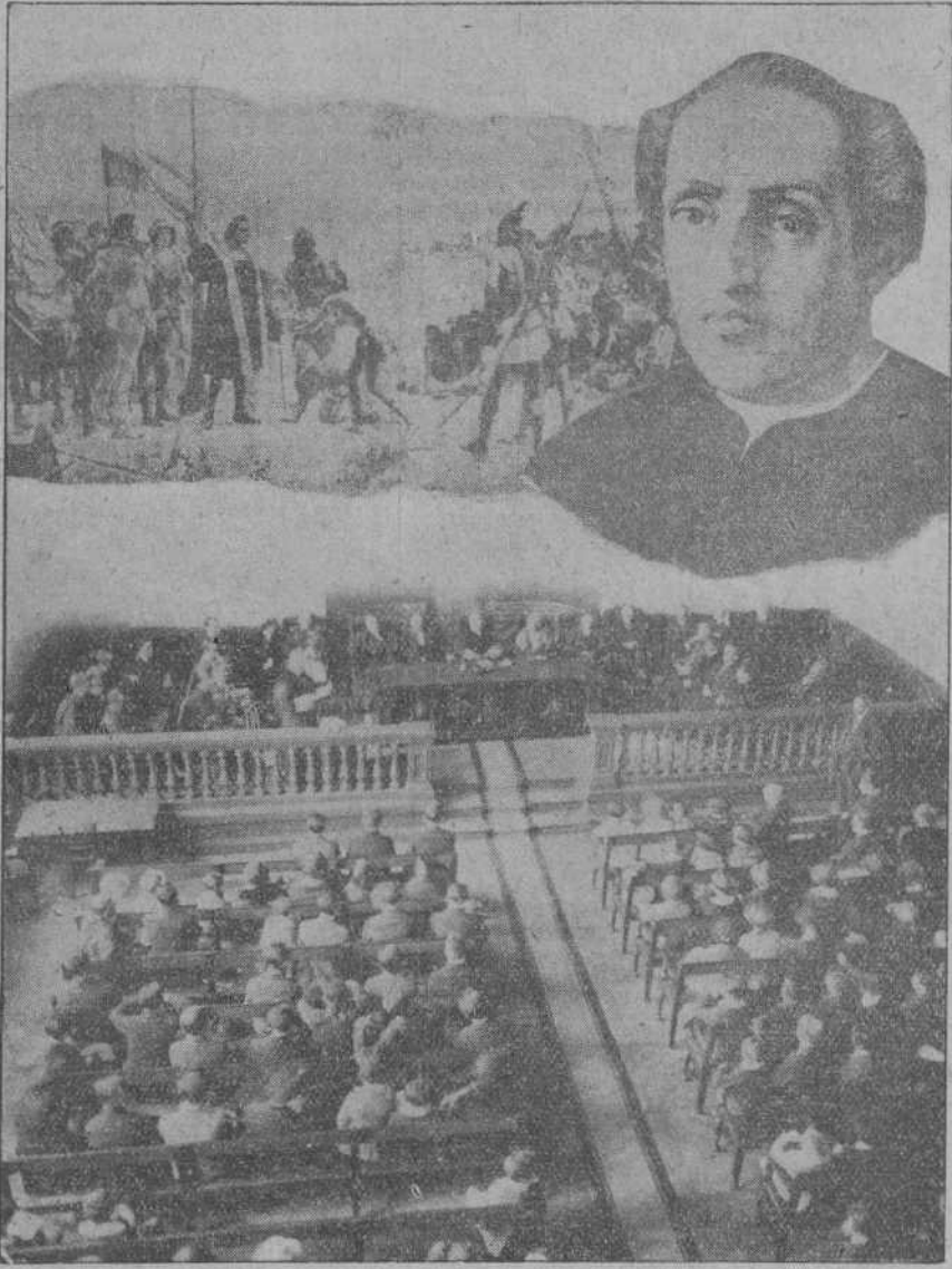
EN EL INSTITUTO SE VERIFICÓ EL DOMINGO UN SOLEMNE ACTO PARA CELEBRAR LA FIESTA DE LA RAZA

En Madrid y en provincias se celebra con gran solemnidad.