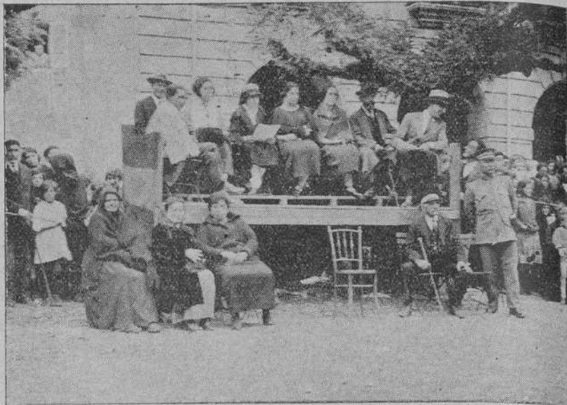
REINOSA.—DEL CERTAMEN DE CANTO Y BAILE REGIONAL: EL JURADO

Las panderetas de sonajas riman su música monótona, aldeana, con las canciones bellas, vibrantes de sentimentalidad y dulces como melopea, que lanza sus trinos al cielo y