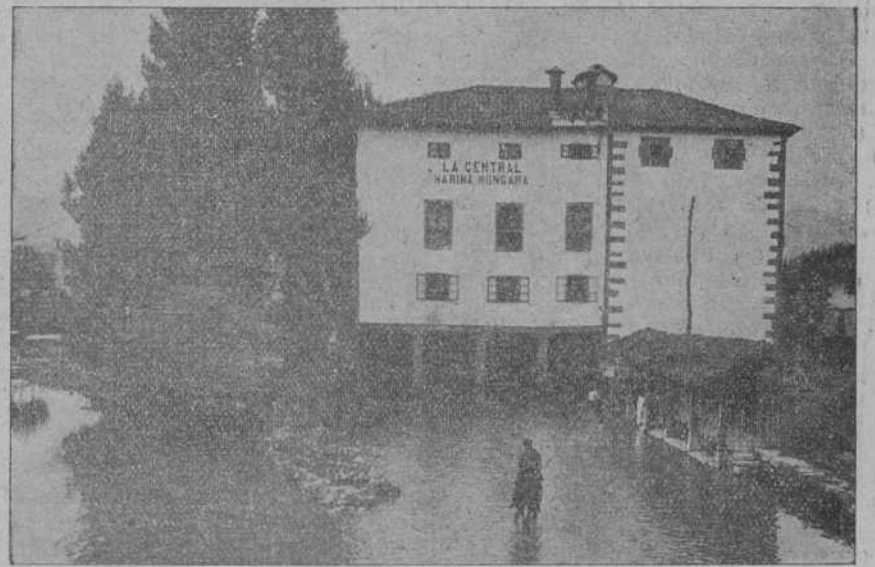
Cilindros PLANSICHTERS "Daverios".—Ultimos perfeccionados