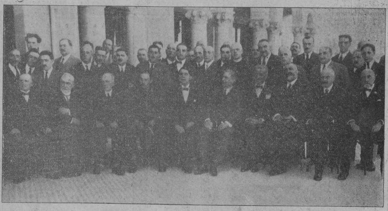
EN EL HOTEL REAL.—LOS SEÑORES QUE OCUPARON LA MESA PRESIDENCIAL DEL BANQUETE EN HONOR DE LA COMISION GESTORA DEL FERROCARRIL, ACOMPAÑADOS DE ALGUNOS DE LOS ASISTENTES AL INOLVIDABLE ACTO.