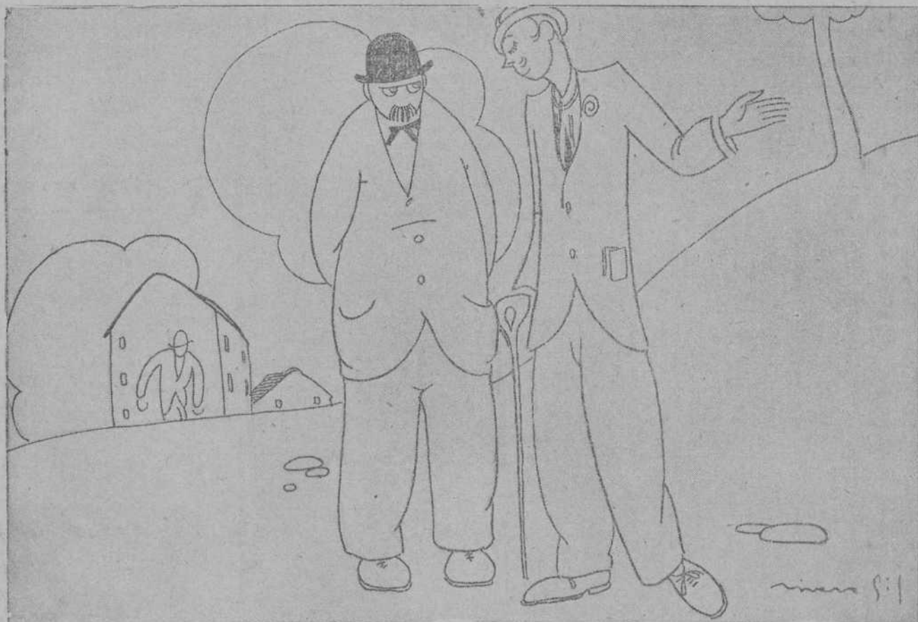
—Esta bien que se adquieran trajes para los bomberos, siempre que se preocupen de las mangas.