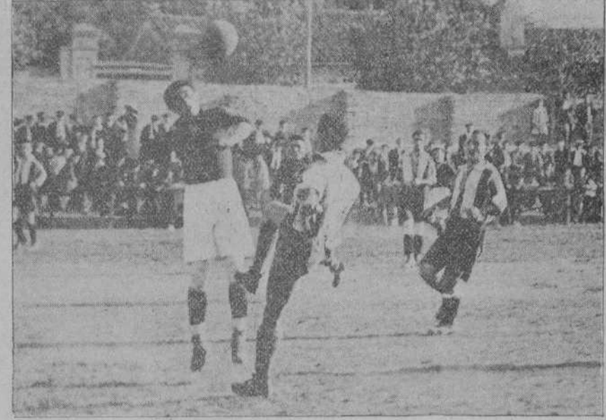
EN MIRAMAR.—Una jugada interesante del partido Unión Montañesa-Baracaldo.