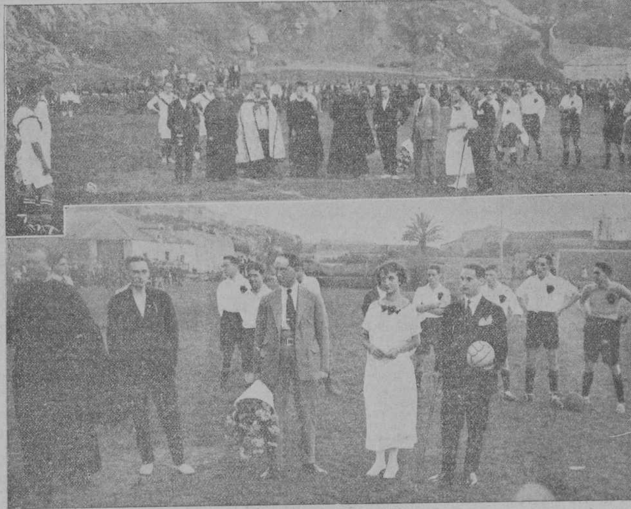
EN SANTOÑA.—Bendición del nuevo campo de deportes.—El alcalde y la madrina momentos antes del saque de honor.