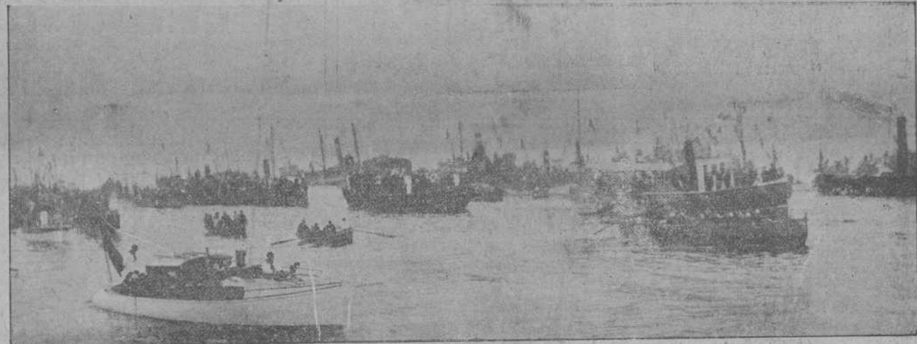
DE LA PROCESION DE AYER.—Momento de embarcar en la góndola las reliquias de los Santos.—Un aspecto de la procesión marítima.

A la entrada de la rampa de Puerto Viejo se elevó otro arco, construido todo él con atributos de los pescadores.