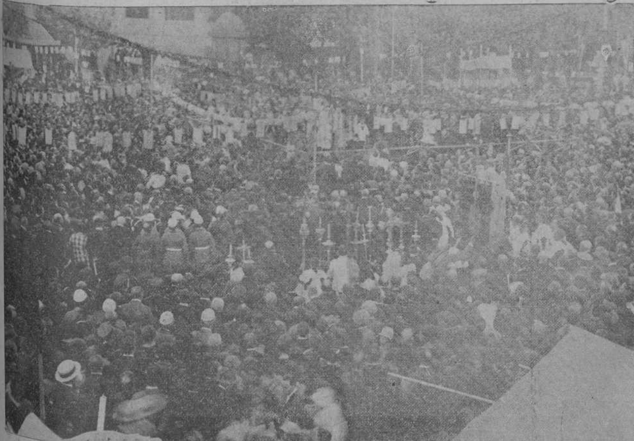
Impenante aspecto que ofrecía la avenida de Alfonso XIII durante el curso del cardenal Benlloch.