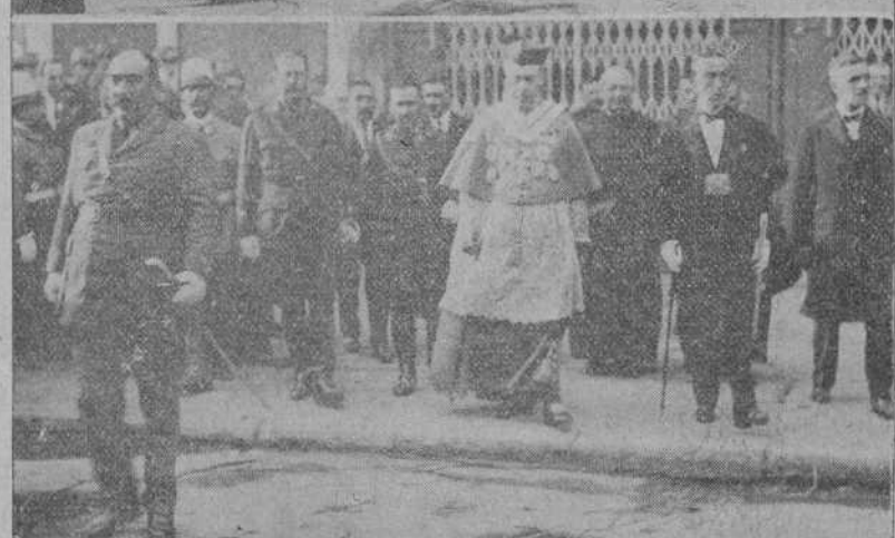
DE LA PROCESION DE AYER.—Las reliquias de los Santos.—Las autoridades con el cardenal Benlloch.