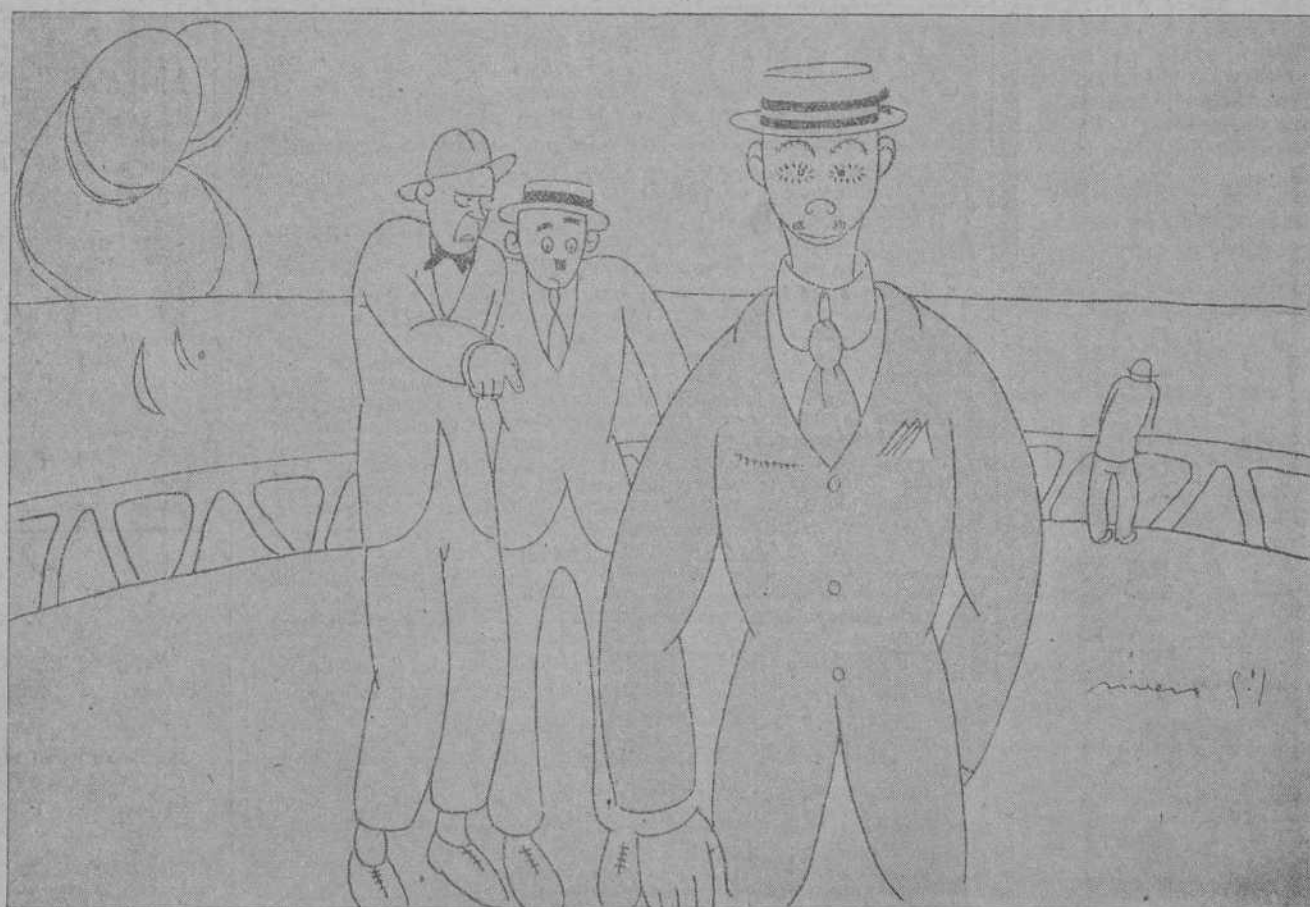
¡Miralo! ¡Ese tiene las niñas extraviadas!...