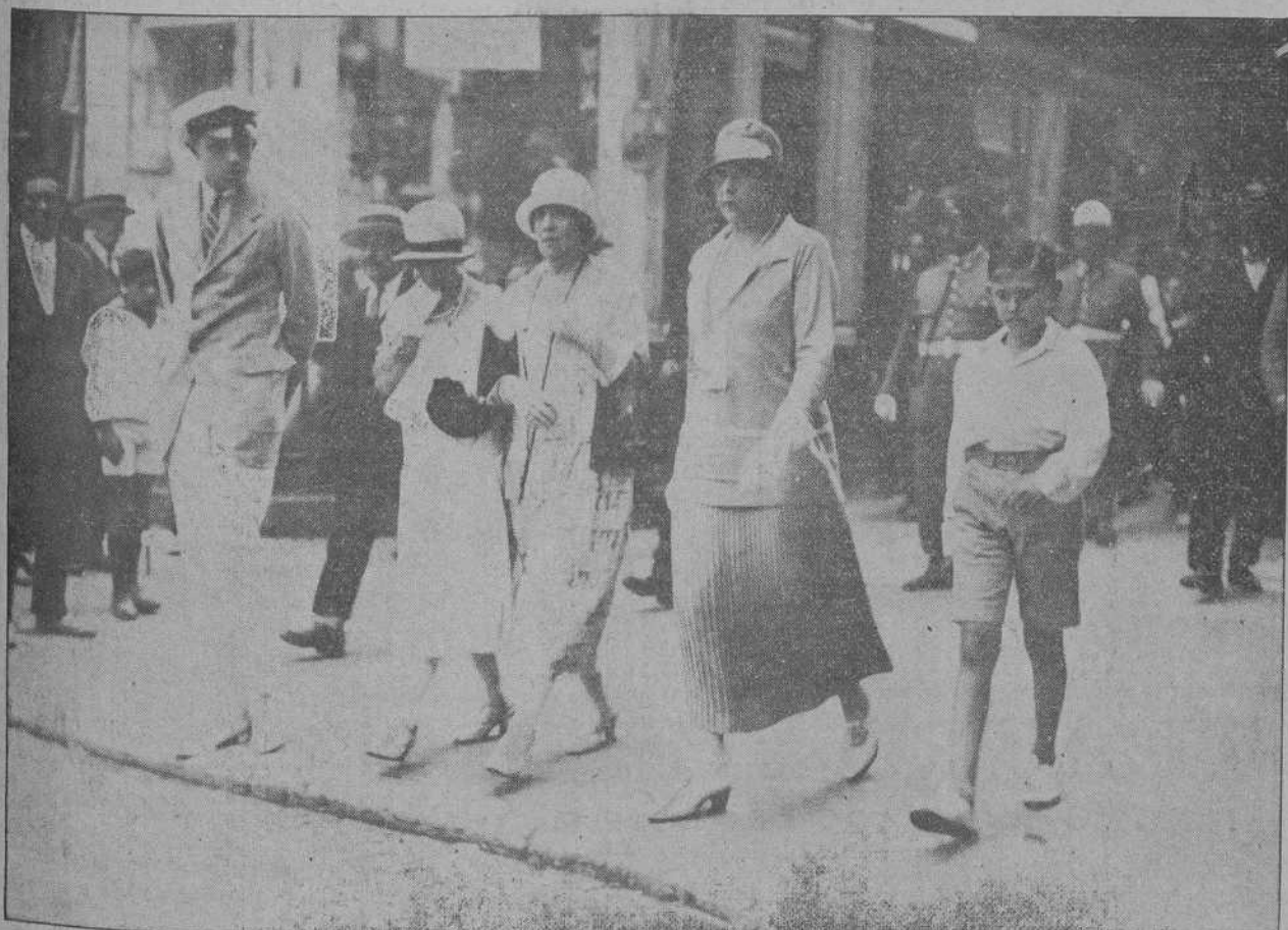
Su Majestad la Reina y los infantes don Jaime y don Juan, acompañados de la duquesa de Santoña y la condesa del Puerto, paseando ayer por las calles de la ciudad.

Para el jueves está señalada la subasta de varias máquinas de escribir embargadas a otro abogado, por el mismo motivo.