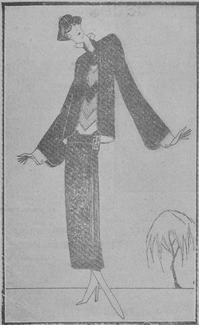
Carta que me dirige desde París, un amigo muy bien documentado en modas.

«Amigo Rosellón: El momento actual de París resulta interesantísimo. «Olimpiadas» ha despertado tan grandes entusiasmos, que no se cabe dentro de este París bullicioso, riente y animado, como antes de la guerra. No hay otro París en el mundo! En él se curan todas las neurastenias, todos los desplines. Por eso está siempre tan lleno de gente, plétórica de preocupaciones y de dinero, que es otra preocupación constante; la de pensar en qué gastar el dinero. Y eso que aquí, en esta Babel del mundo elegante y frívolo, el dinero no tiene más valor que el que quieren darle los artistas.