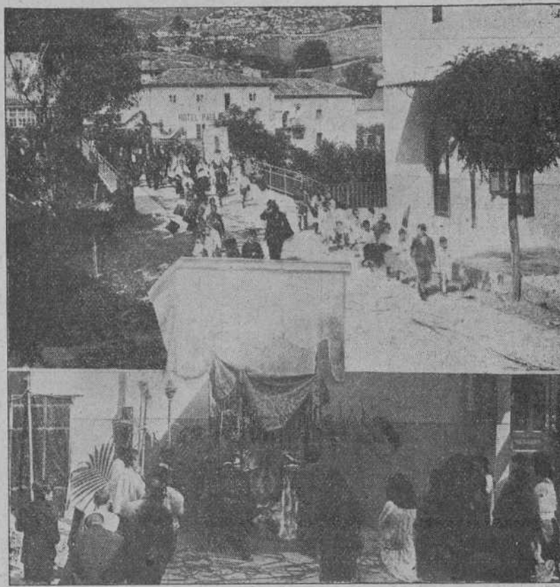
PUENTE VIESGO.—LA PROCESION DEL CORPUS AL PASAR POR HERMOSO PUENTE.—ARTISTICO ALTAR LEVANTADO EN EL GRAN HOTEL.

De la villa de Campoo? Pero dejar que las trompetas, esas trompetas, pero no las de la fama lancen al viento las bombas escritas. Y estos renglones son recogidos bajo las censuras que se oían a todos los que tenían ocasión de pasar por la calle de Peñas Arriba, pues en vez de una calle parecía un estero-cero, pues lo más gracioso era que el mayor montón estaba situado