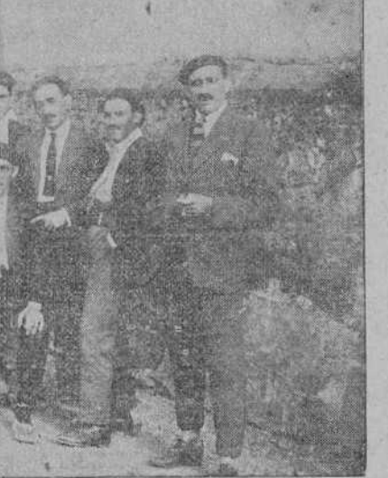
EL CORRESPONSAL DE VEGA DE CARRIEDO