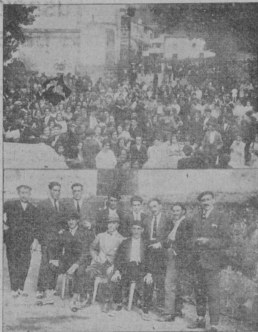
VEGA DE PAS.—Un aspecto de la romería celebrada recientemente.—Grupo de jóvenes organizadores de los festejos.

sa de Tormes, como los The Ollivays, dos años de edad, la hermosa joven las hermanas Obiol y la genial estrella Rosine obtuvieron grandes éxitos, siendo aplaudidísimos todos sus trabajos por el numeroso público que llenaba las secciones.