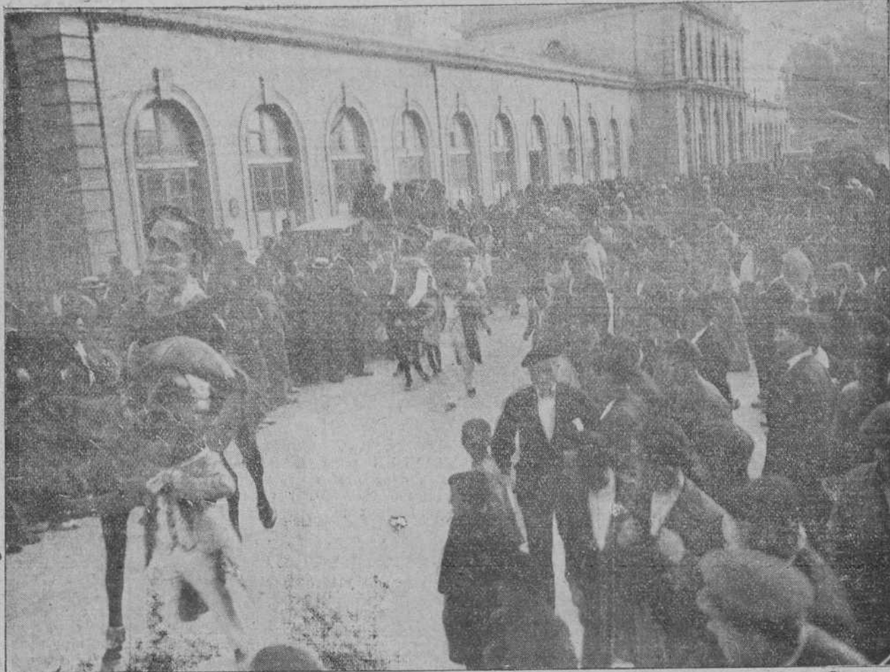
Aspecto que ofrecía ayer tarde la parte exterior de la estación del Norte, a la llegada de la Banda de música de Reinosa y los cantadores de Campoo.

La alameda se ha limpiado y adecentado cuidadosamente, habiendo