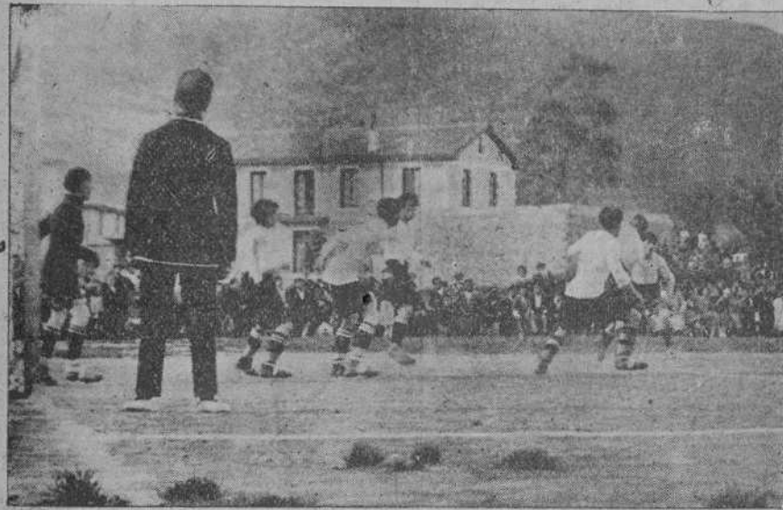
FINAL DEL CAMPEONATO, SERIE C.—Un momento del partido Montaña Olímpica-Unión Santofesana.