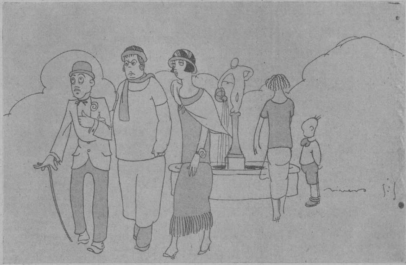
—¡Es insólito, mamá! ¡Ni un pipero en toda la tarde!... —¡Ya, ya! ¡Y luego dicen que estamos en el mes de las flores!...

Daban guardia los mozos de escuadra, y en la plaza de San Jaime rin-