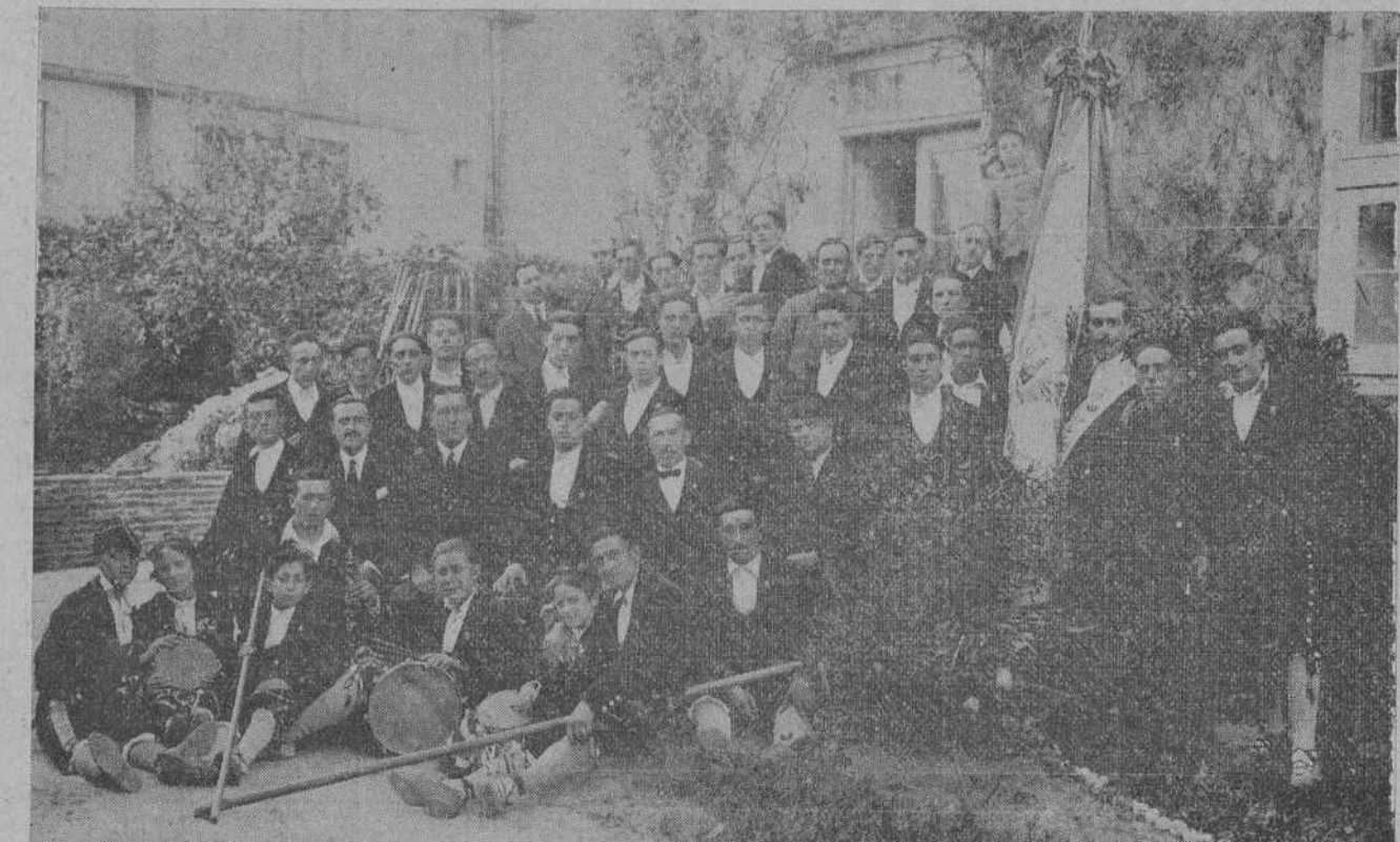
Los notables coros montañeses «El sabor de la Tierra», en el jardín de la casa del señor Albo, en Santaña.