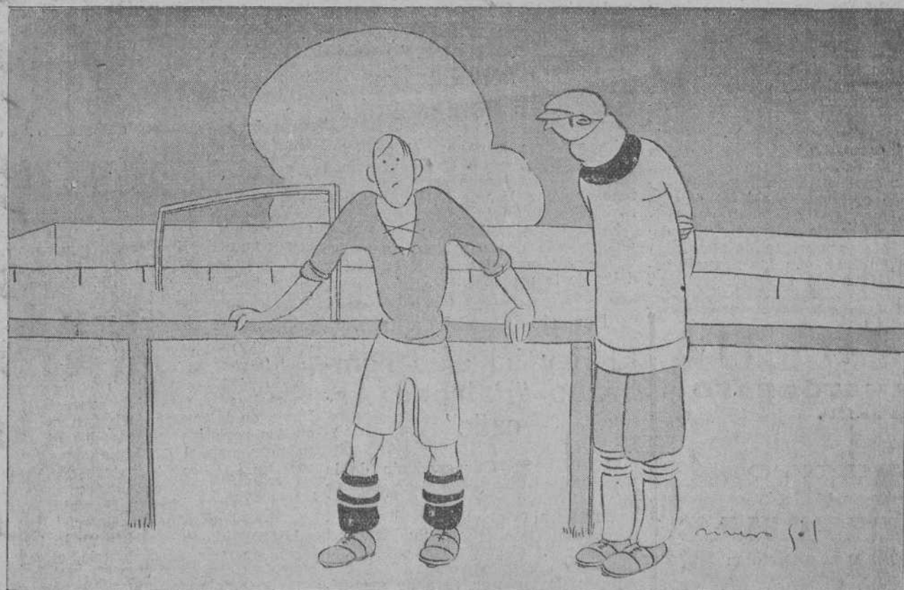
Si, hombre. Hay que tener cuidado con los «ganchos», porque cuando menos lo pienses te ves «colgado».