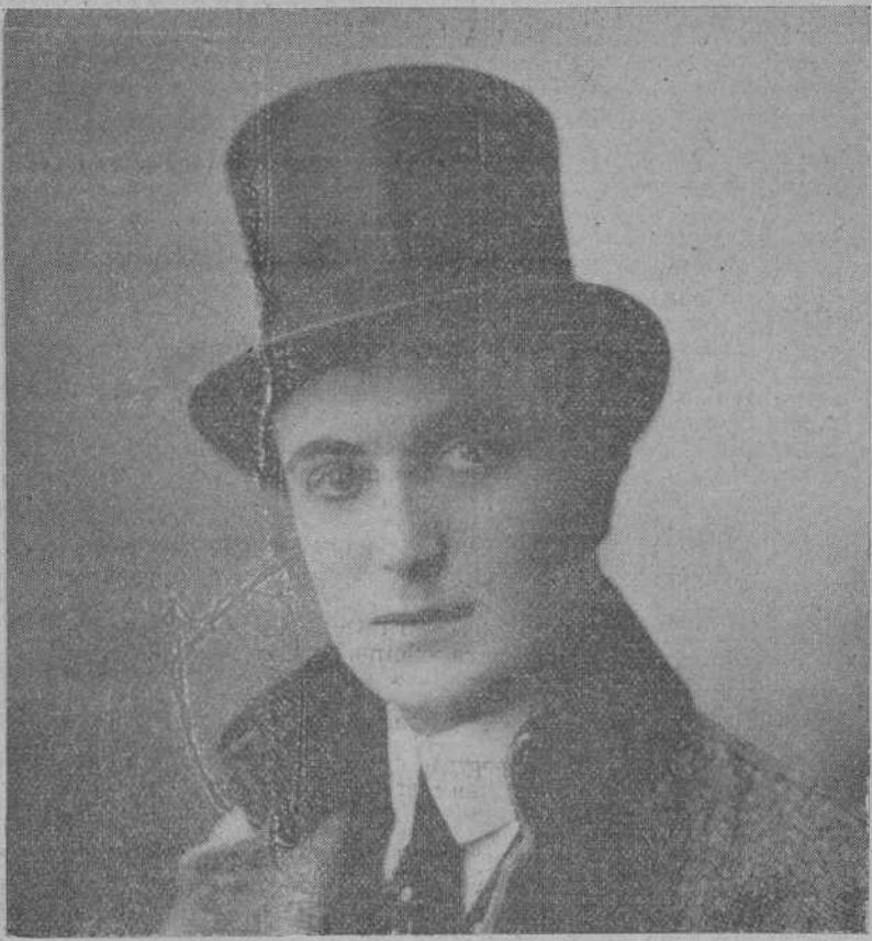
PEPE BUCHS, el primer «metteur en scène» español y simpático paisano nuestro.