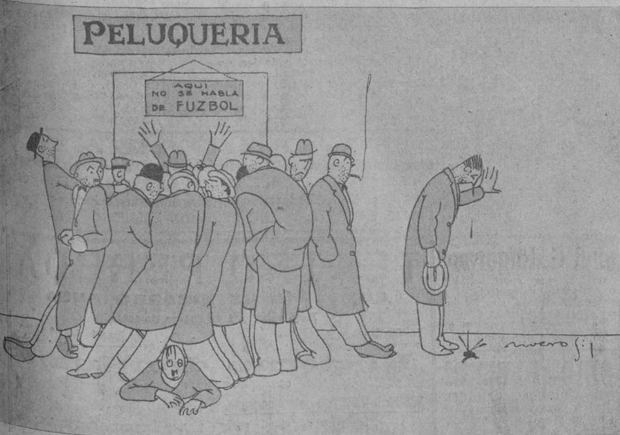
N. de parte de la R.—Tan identificados estamos con la crítica que representa el dibujo, que no le ponemos pie. ¡No vaya a ser que resulte también de los que chutan!