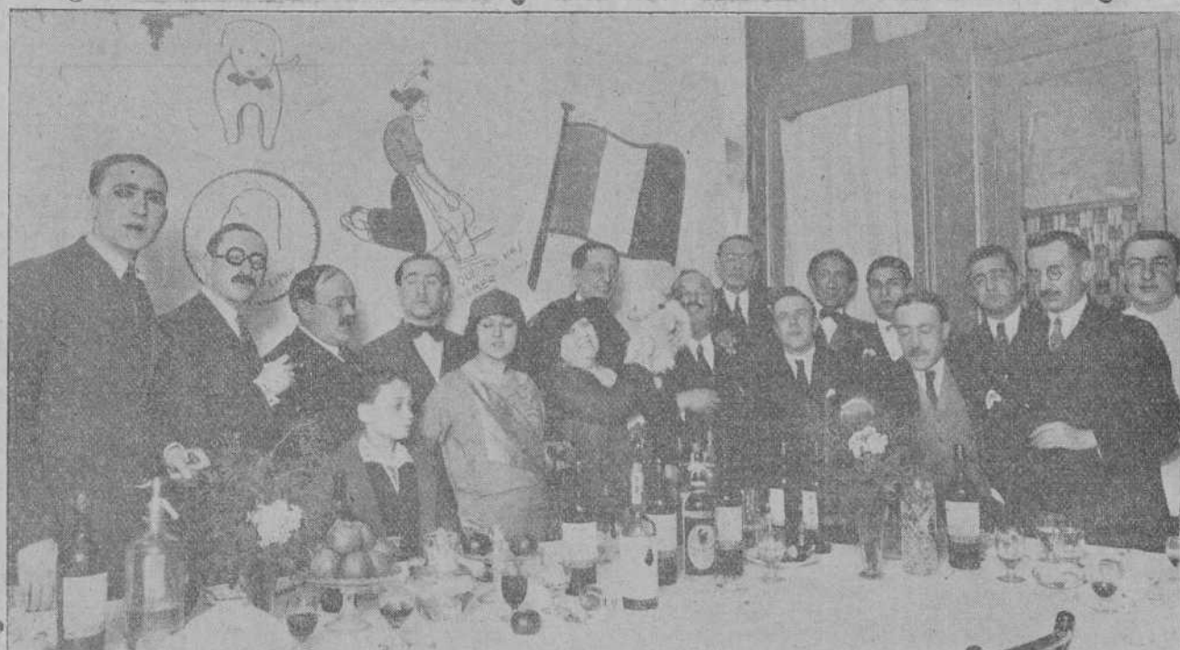
GRUPO DE ASISTENTES AL BANQUETE EN EL RESTAURANT "LA CÁTEDRA".

No creemos que los señores culturales se atrevan a negarnos a los que trabajamos en esta casa la gratísima satisfacción de llevarnos como hermanos y el derecho a tener un poquito de buen humor.