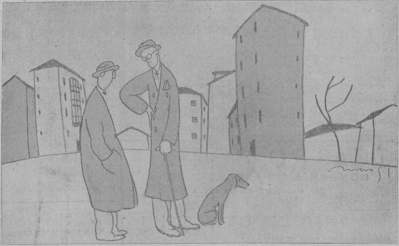
—YA TE VI AYER EN EL ATENEO... ¿TE GUSTO LA CONFERENCIA? —¡PDHS! HABIA FOCAS CHIU AS.