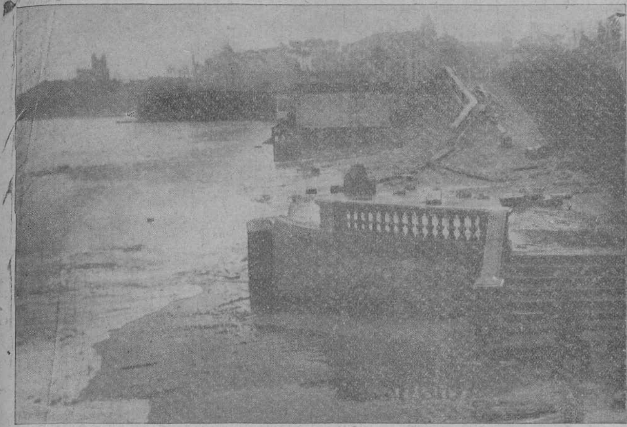
LUGAR QUE OCUPABA LA CASETA REAL EN LA PRIMERA PLAYA Y QUE FUE DESTRUIDA AYER A CAUSA DEL FUERTE TEMPORAL.

ANUNCIO Se avisa a los señores contribuyentes que han solicitado el pago anticipado de sus cuotas en el cuarto trimestre del año económico de 1923-24, que pueden hacer efectivos sus respectivos recibos en la Depositaria-Pagaduría de Hacienda los días 11, 12 y 14, de diez a doce de la mañana. Santander, 9 de enero de 1924.—El tesorero de Hacienda, Salustiano Casas.