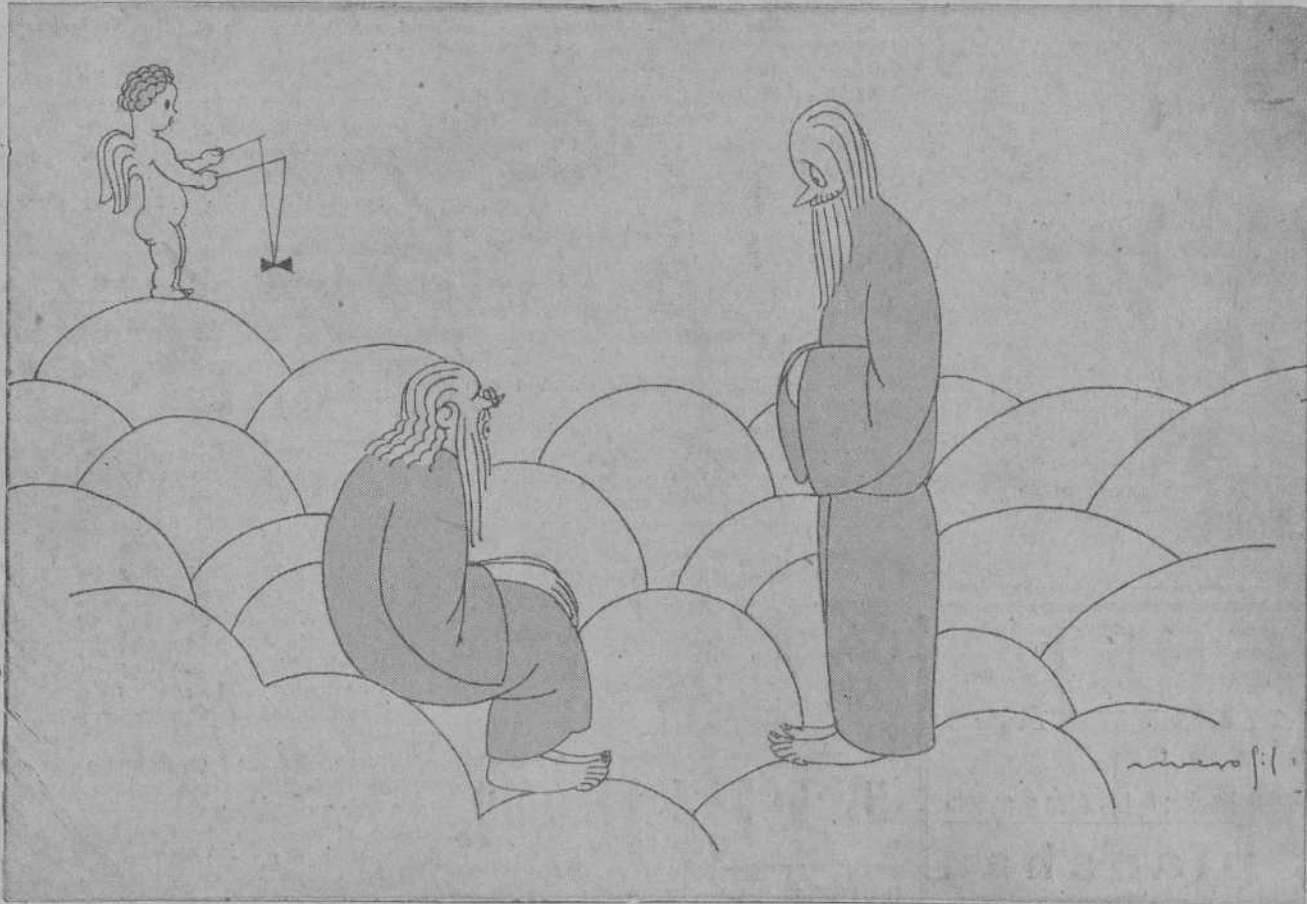
EL SANTO JOB.—De modo que usted era...