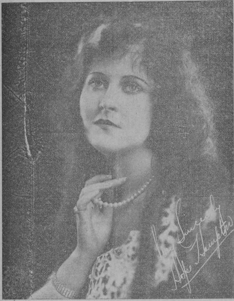
HOPE HAMPTON, BELLISIMA AGRIZ DE LA «PARAMOUNT», PROTAGONISTA DE «EL ANZUELO».

diosa serie en dos jornadas «Robin de los bosques», por Enid Bennet y Douglas Fairbanks, la obra cumbre de este artista y uno de los mayores triunfos de la cinematografía artística contemporánea, según ha reconocido toda la Prensa de Europa y América.