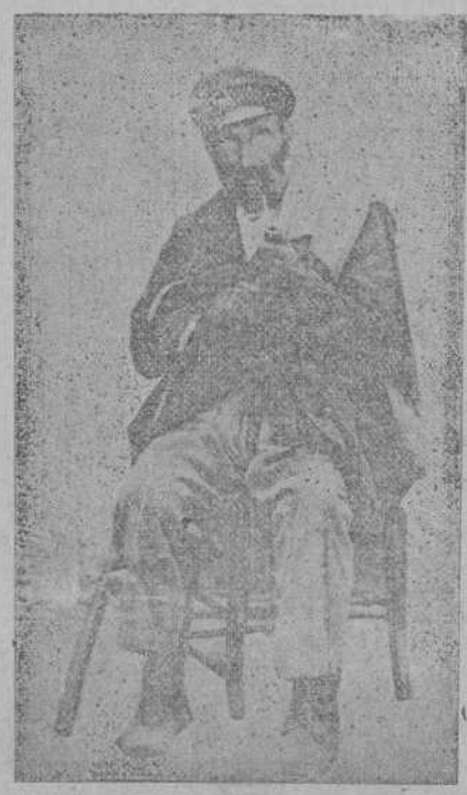
BEINOSA.—El ciego de Fontecha, tipo popular.

De entre todos estos miserables la figura del ciego adquiere cierto aspecto de tristeza honda, que llegaba hasta el alma con todos los reflejos de la melancolía. La primera impresión al ver aquel rostro curtido por el sol y el frío era de tragedia. Expresaba la cara morena, de matices algo cobrizos, muecas risueñas, y como una ironía de la vida, abriendo un paréntesis de dolor, los ojos muertos, lagos azulosos de la ilusión, que ni veían el cielo de las realidades. Dejaba en toda su persona un abandono y desaliño tan marcados, que los pobres harapagos manifestaban con la más elocuente de sus tristes expresiones, el inmenso dolor de