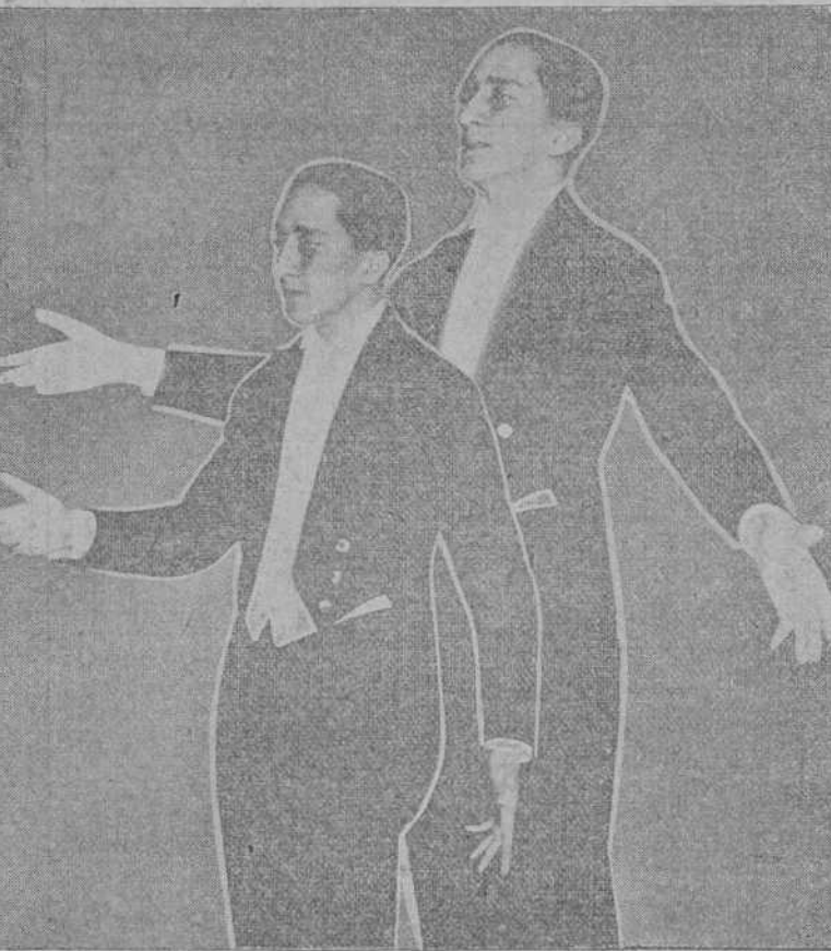
EL POETA VENEZOLANO DON ANDRES ELOY BLANCO RECITANDO SU POEMA «CANTO A LA MADRE ESPAÑA», EN LA FIESTA DE ANOCHE

¡Poeta, labrador, soldado, todos, en diversos altares y por distintos modos, poetas, por número vital del optimismo!